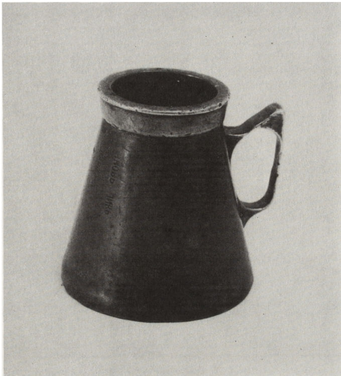
Ryc. 47. Pojemnik gorzelniiany, pocz. XX w., nr inw. MNKi/H/4298