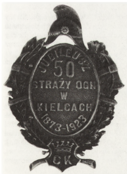
Ryc. 48. Odznaka wydana z okazji 50-lecia Straży Ogniowej w Kielcach, 1923 r., nr inw. MNKi/H/4300