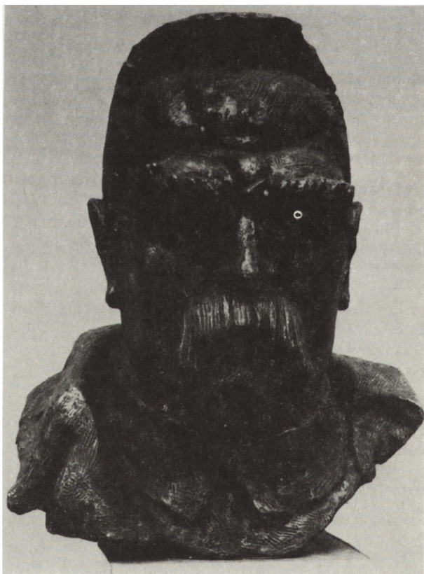
Ryc. 50. Głowa Marszałka Józefa Piłsudskiego, autorstwo nieznane, gips, lata 30. XX w., nr inw. MNKi/H/4506

Zbiory kartograficzne działu poszerzyły się także o przekazany z Działu Przyrody zespół 200 map topograficznych i sztabowych, rosyjskich, austriackich, polskich i niemieckich z przełomu XIX i XX stulecia, lat pierwszej wojny światowej, dwudziestolecia międzywojennego i drugiej wojny światowej, przedstawiających tereny Małopolski Wschodniej, zachodnich guberni Cesarstwa Rosyjskiego, Królestwa Polskiego (m.in. Kielce i okolice), Rzeczypospolitej Polskiej z lat 30. (interesujące mapy opracowane w Wojskowym Instytucie Geograficznym w Warszawie), Generalnego Gubernatorstwa z lat drugiej wojny światowej. Mapy te pochodzą ze zbiorów Instytutu Badań Regionalnych w Kielcach. Obecnie są opracowywane w Dziale Historii, a najciekawsze z nich zostaną włączone do Katalogu map ze zbiorów Działu Historii Muzeum Narodowego w Kielcach .