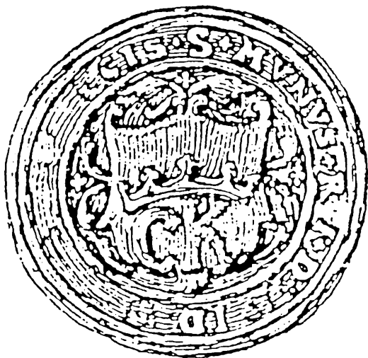
Ryc. 4. Herb Kielc na pieczęci z 1566 r. (W. Wittyg, Pieczęcie miast dawnej Polski , z. 2, Kraków 1907, s. 112—113)

W Starożytnej Polsce M. Balińskiego i T. Lipińskiego umieszczono herb miasta zgodnie z dotychczasowymi przedstawieniami wraz z niewielkim opisem, podobnym jak w opracowaniach już cytowanych: „Złota korona w czerwonym polu a pod nią głoski C. K. [Civitas Kielce] jest herbem miejskim” 28 .