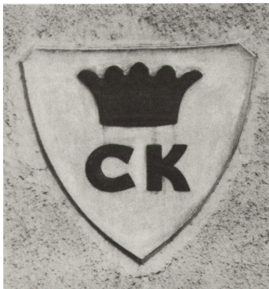
Ryc. 15. Herb Kielc na jednej z kamie- nic w Rynku 3—5