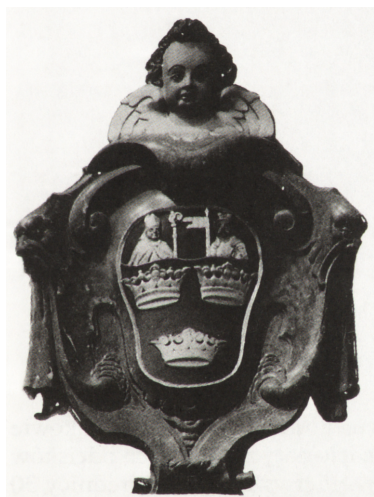
Ryc. 3. Herb kapituły krakowskiej — jeden z trzech znajdujących się nad loggią wejściową pałacu biskupiego w Kielcach

krakowskiej, tak jak dobra te składały trzecią część dóbr biskupów krakowskich”. Notatka kończy się uwagą, że herb nadany został „w końcu XV wieku przez królewicza Fryderyka kardynała biskupa krakowskiego” 24 .