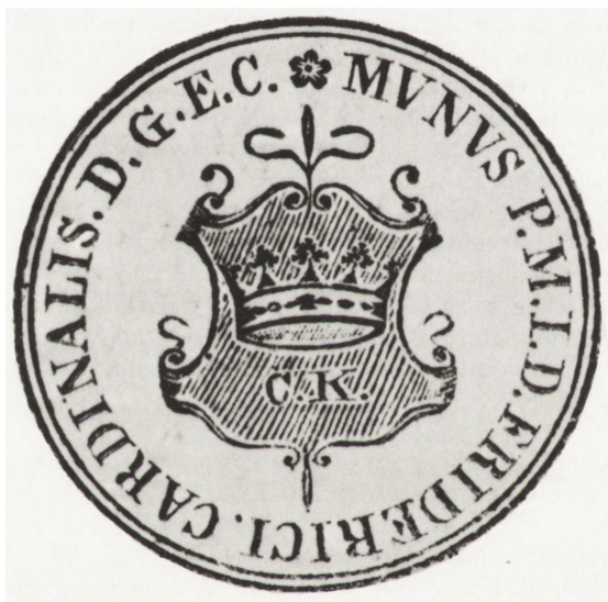
Ryc. 1. Herb Kielc ( Pamiętnik Sandomierski , t. 1, Warszawa 1829, s. 68)

Najstarszy zapis poświęcony godłu miejskiemu Kielc umieszczony został w Pamiętniku Sandomierskim wydanym w 1829 r. Obok wizerunku pieczęci miasta Kielc zamieszczono jej opis oraz krótką notatkę dotyczącą genezy herbu. Autor podkreślał znaczenie miasta, które „w tak krótkim czasie do porządku i znaczenia przyszło” 23 , co niewątpliwie miało związek z jego przeszłością jako ważnego ogniwia posiadłości biskupów krakowskich.