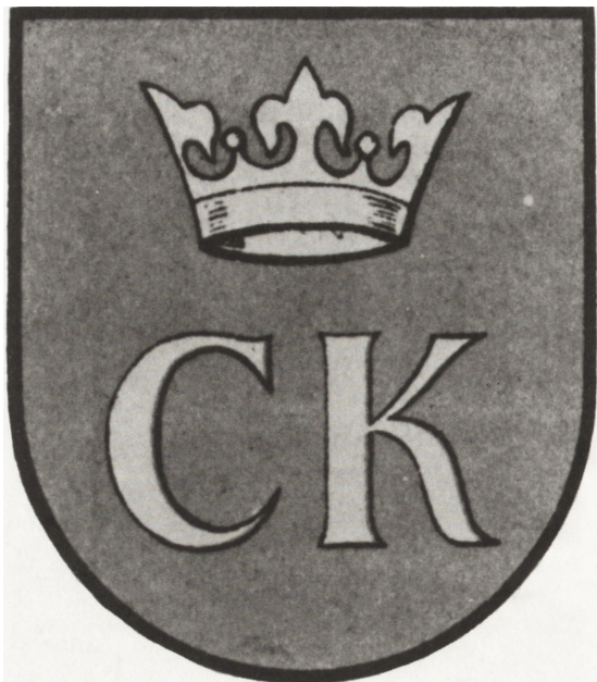
Ryc. 13. Herb Kielc (M. Gumowski, Herby miast polskich , Warszawa 1960, s. 197)