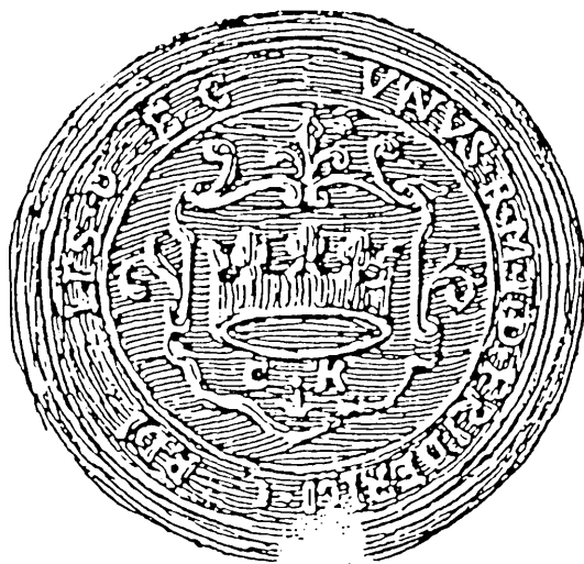
Ryc. 5. Herb Kielc na pieczęci z XVIII w. (W. Wittyg, Pieczęcie miast dawnej Polski , z. 2, Kraków 1907, s. 112—113)

uszkodzony napis: „S + MVNVS + RI + D + FRIDER ...CIS +”. Druga — odcisk pieczęci o średnicy 37 mm posiada w legendzie otokowej napis podobny: „MVNVS R.M.I.D.FRIDERICI.CARDINALIS.D.G.E.C.” Obraz pola pieczętnego jest identyczny jak na pieczęci XVI-wiecznej 29 .