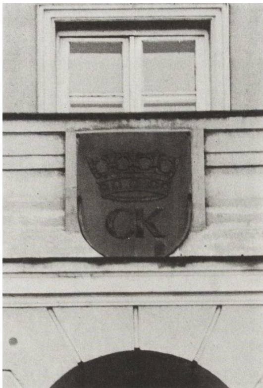
Ryc. 14. Herb Kielc na budynku Urzędu Miasta (nad zachodnim wejściem)