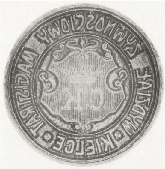
Ryc. 10. Herb Kielc, ok. 1920 (pieczęć Wydziału Żywnościowego UM w Kielcach, wł. Muzeum Narodowego w Kielcach, nr inw. MNKi/H/1935)

Po odzyskaniu niepodległości dekretem z 28 sierpnia 1919 r. próbowano uporządkować zasady używania herbu państwowego, czyli wizerunku orła przez instytucje niepaństwowe 69 . Samorządy miejskie mogły się posługiwać swoimi herbami historycznymi, natomiast miasta, które takowych nie posiadały, mogły używać pieczęci napisowych. Problem ten nie dotyczył oczywiście Kielc, gdyż korzystano tutaj ze starego wzorca, a znakomitym tego przykładem jest tłok pieczętny Wydziału Żywnościowego Magistratu używany aż do lat dwudziestych 70 .