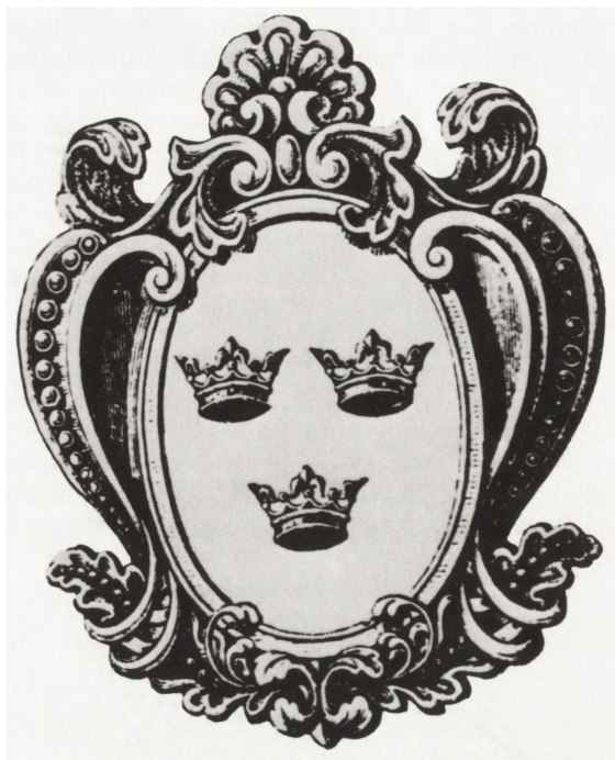
Ryc. 2. Herb kapituły krakowskiej (K. Niesiecki, Herbarz polski , t. 1, Lipsk 1839—1846, s. 34)