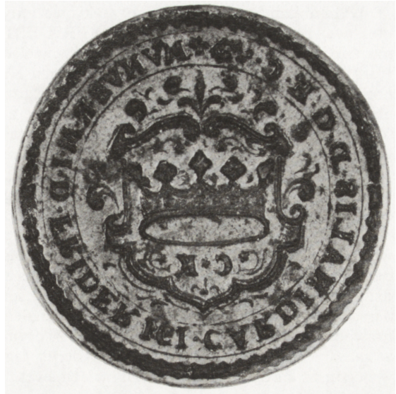
Ryc. 6. Herb Kielc, XVII/XVIII w. (tłok pieczętny, wł. Muzeum Narodowe w Kielcach, nr inw. MNKi/H/2)