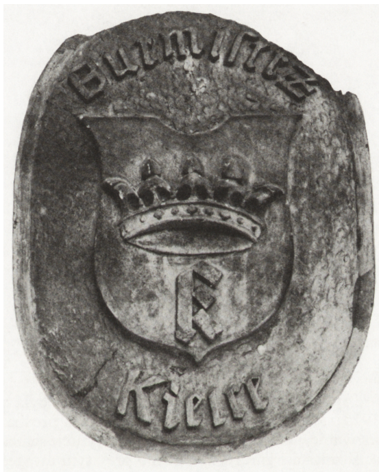
Ryc. 9. Herb Kielc, 1915 (kartusz herbowy, wł. Muzeum Narodowego w Kielcach, nr Ks. m./237)

Jest to niezwykle interesujące przedstawienie miejskiego herbu. Okupacyjne władze austriackie wprowadziły bowiem do kartusza herbowego literę „K” pod koroną, zamiast inicjałów „CK”. Po raz pierwszy odstąpiono od tradycyjnego herbu samorządowego Kielc. Sądzić należy, że było to odstępstwo zamierzone. Inicjały „CK” oznaczały przecież termin „cesarsko-królewski”, a więc użycie ich w herbie miasta byłoby niezręczne i nawet niezrozumiałe. Postąpiono więc celowo, zmieniając kilkusetletnią już formułę godła miejskiego.