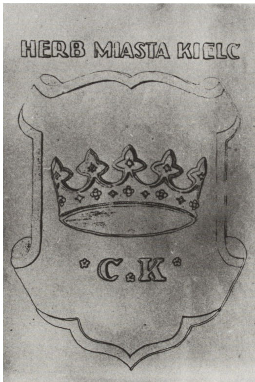
Ryc. 12. Herb Kielc wg załącznika do pisma Rady Artystyczno-Konserwatorskiej, 1939 r., zbiory prywatne

wzorców, odrzucając próby daleko idących zmian 93 . Po klęsce wrześniowej i powstaniu Generalnego Gubernatorstwa posługiwano się pieczęciami z tradycyjnym herbem miasta, początkowo z napisami w języku polskim, później z legendą niemiecką 94 .