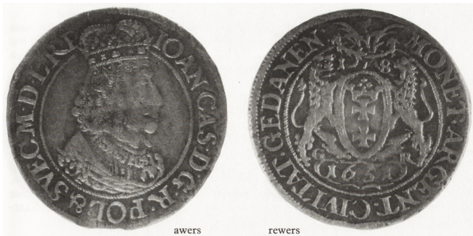
Ryc. 23. Ort gdański Jana Kazimierza z 1651 r., nr inw. MNKi/N/632