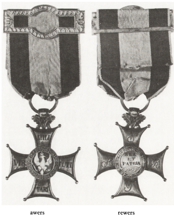
Ryc. 28. Krzyż Srebrny Orderu Wojskowego Polskiego, po 1817 r., nr inw. MNKi/N/67

szych, których wartości nie podkreślono, a których rodowód sięga przedwojennych zbiorów Muzeum PTK w Kielcach.