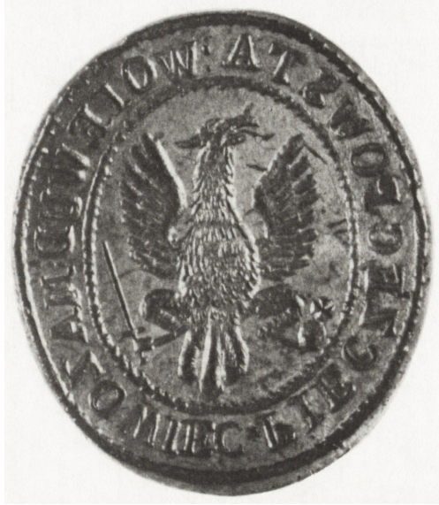
Ryc. 27. Pieczęć Województwa Mazowieckiego z lat 1862—1863, nr inw. MNKi/N/50

co sprawiło, iż starsi cechowi nie zdecydowali się na ponowne rytowanie wadliwego stempla, a tylko na jego reperację? Prawdopodobnie oszczędność przeważała nad dążeniem do plastycznej doskonałości.