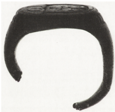
Ryc. 26. Sygnet z gmerkiem i monogramem „GI” z XVI w., nr inw. MNKi/N/1

Unikatowym wręcz eksponatem jest XVI-wieczny sygnet z gmerkiem, znaleziony na zboczach wzgórza zamkowego w Chęcinach (MNKi/N/1). Gmerk to znak osobisty lub rodzinny, używany przez mieszczan, a niekiedy także chłopów. Pojawił się w Polsce w XV w. pod wpływem herbu rycerskiego. W zasadzie spełniał wyłącznie funkcję znaku rozpoznawczo-własnościowego, toteż umieszczany bywał na budowlach, przedmiotach użytkowych, tłokach pieczętnych oraz sygnetach. Prezentowany gmerk wygrawerowano na owalnym polu. W jego obrębie u góry litery: „GI”, poniżej na kartuszu w kształcie tarczy renesansowej kombinacja poziomych i pionowych kresek, charakterystyczna dla tego typu obiektów.