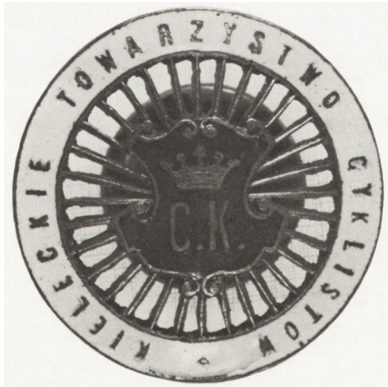
Ryc. 29. Odznaka Kieleckiego Towarzystwa Cyklistów, nr inw. MNKi/H/4647