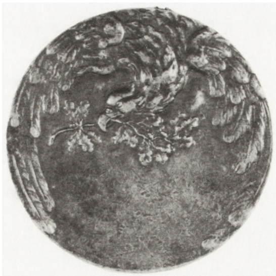
Ryc. 31. Medal pamiątkowy 4 Pułku Piechoty Legionów, nr inw. MNKi/H/4556

interesujących wydarzeniach mówią fotografie wykonane 16 października 1937 r., przedstawiające marszałka odbierającego defiladę przed Domem WF i PW w Kielcach. Kolejne, pochodzące z zakładu fotograficznego „Moderne” w Kielcach, dokumentują złożenie prochów hetmana Jana Czarnieckiego w Czarncy i przegląd oddziałów 2 PAL, z udziałem Rydza-Śmigłego (MNKi/H/4721-4726).