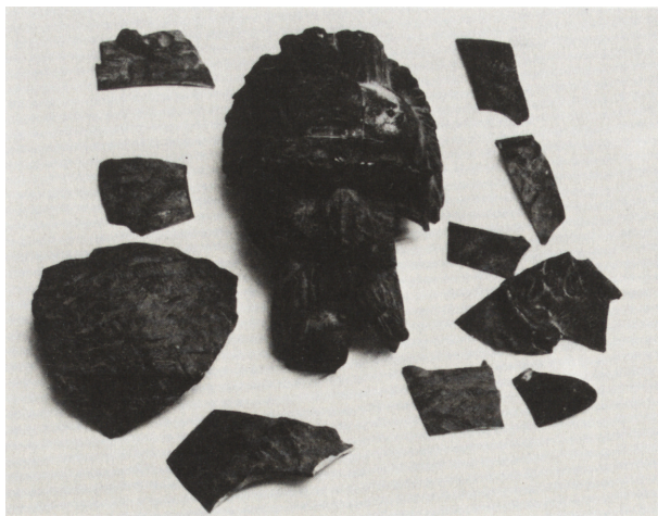
Ryc. 32. Ocalałe fragmenty popiersia Józefa Piłsudskiego autorstwa Stanisława Rzeckiego,