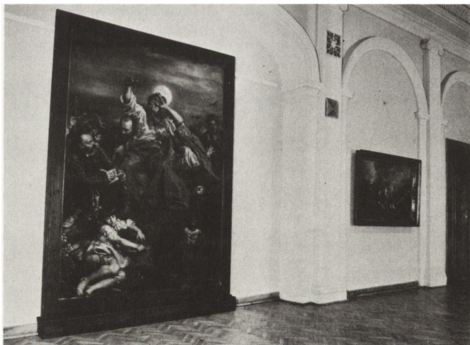
Ryc. 4. Wystawa Arcydzieła malarstwa polskiego z Galerii w Sukiennicach — fragment pokazu z Wernyhorą Jana Matejki na pierwszym planie

Zwiedzający mogli się także zapoznać z dużą grupą pejzaży i scen rodzajowych na tle pejzażu. Wymienić tu należy obrazy Józefa