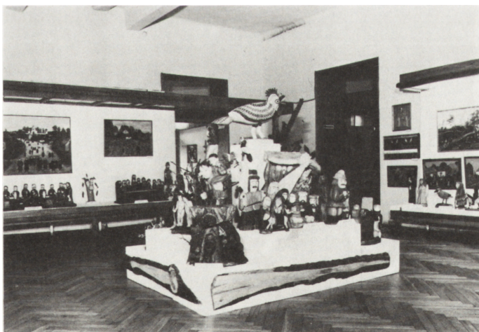
Ryc. 3. Fragment wystawy Współczesna sztuka ludowa Kieleccyzny — sala IV