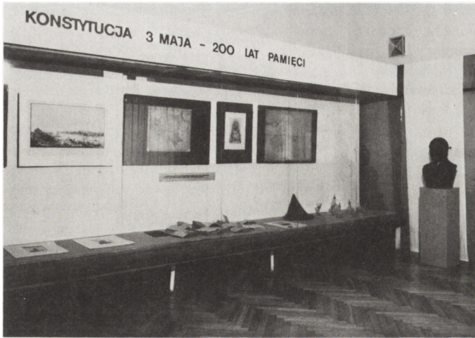
Ryc. 5. Fragment wystawy Konstytucja 3 maja. 200 lat pamięci