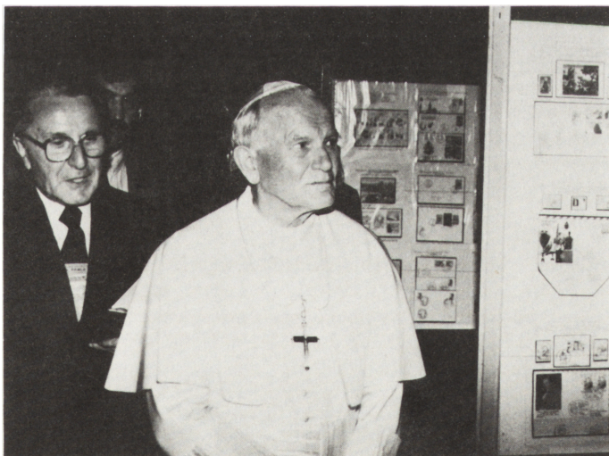
Ryc. 1. Wizyta papieża Jana Pawła II w pałacu kieleckim. Ojciec Święty ogląda wystawę Totus Tuus '91

Tuus '91 . W sali obok, w Drugim Pokoju Pralatów, oczekiwała szczególnego rodzaju niespodzianka — okazały wizerunek papieża pędzla kieleckiego malarza Krzysztofa Jackowskiego. Pomyślany początkowo jako kolejny portret biskupa krakowskiego, nawiązujący charakterem do portretów z fryzu podstropowego w Izbie Stołowej Górnej, miał zamykać tę galerię podobizną najślawniejszego spośród wszystkich. Ostatecznie po dyskusji, ze względów historycznych i konserwatorskich odstąpiono od tej koncepcji i zdecydowano się na kompozycję sztalugową. Tworząc ją, artysta skupił się na istocie misji papieża i ukazał Jana Pawła jako samotnego pątnika-wędrowca zmagającego się