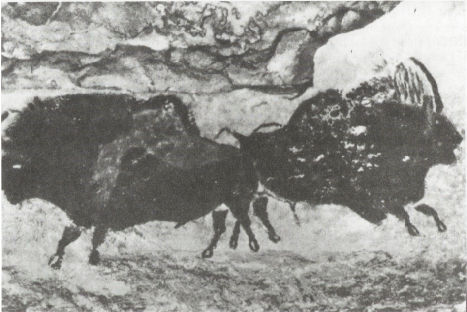
Ryc. 1. Dwa bizony: malowidło długości 240 cm z jaskini Lascaux, Francja; wg Jelinka

Drugim takim sanktuarium jest odkryta w 1940 roku słynna grota w Lascaux w południowo-zachodniej Francji koło miasta Montignac, która także była nazywana „Kaplicą Sykstyńską epoki lodowcowej” 4 . Znajdujący się w niej wizerunek dwóch czarnych byków, będących w ruchu, jest szczególnie interesujący (ryc.1).