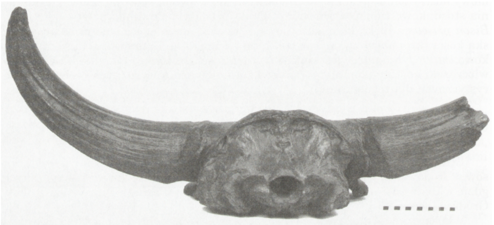
Ryc. 5. Mózgowieczaszka Bison priscus z Muzeum Narodowego w Kielcach widziana od tyłu

wieczaszka. Jednakże na całej długości krawędzi występują duże ubytki tych kości (ryc. 4). Całkowicie odłupane są części nosowe kości czołowej, które wciskają się między kość łzową i nosową. Zachowany fragmentarycznie brzeg oczodołowy kości czołowej nie wykazuje wyraźnych zgrubień. Brak jest na powierzchni zewnętrznej pierścienia oczodołowego bruzd naczyńiowych. Tarcza karkowa jest bardzo dobrze zachowana, jedynie po stronie prawej występuje znacznych rozmiarów ubytek (ryc. 5). Linia karkowa górna ma postać poprzecznego wyraźnie zaznaczonego wału kostnego wystającego ku tyłowi ponad tarczę karkową. Na boki przedłuża się w grzebień skroniowy, który po stronie prawej wykazuje znacznych rozmiarów ubytek. W wyniku tego brak jest fragmentu krawędzi bocznej tarczy karkowej po stronie prawej. Guzowatość potyliczna zewnętrzna bardzo dobrze zaznaczona ma postać trójkąta prostokątnego o wierzchołku wyraźnie skierowanym ku dołowi.