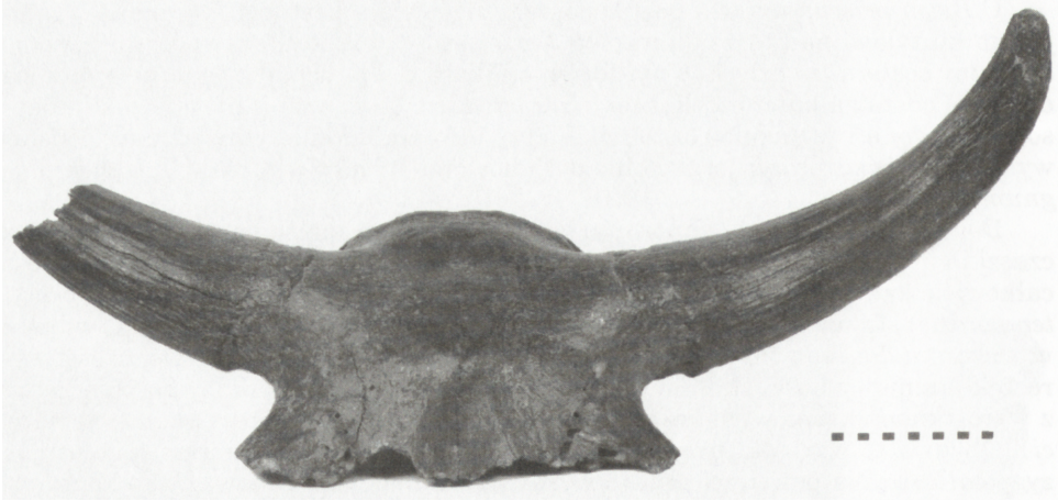
Ryc. 4. Mózgowieczaszka Bison priscus z Muzeum Narodowego w Kielcach widziana od przodu