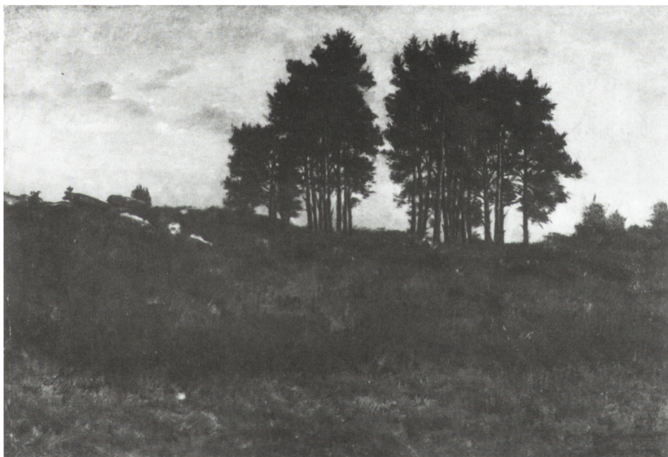
Ryc. 1. M. Gierymski(?), Pejzaż z sosnami , depozyt Fundacji Kultury w Warszawie

Ponadto dział przechowuje depozyty z zakresu malarstwa, m.in.: dwa obrazy pędzla Jerzego Wolffa (1902–1986) – Pożar Sodomy z 1974 r. i Kompozycję z ideogramem z 1978 r., własność Muzeum Narodowego w Warszawie (nr inw. MPW: 639,