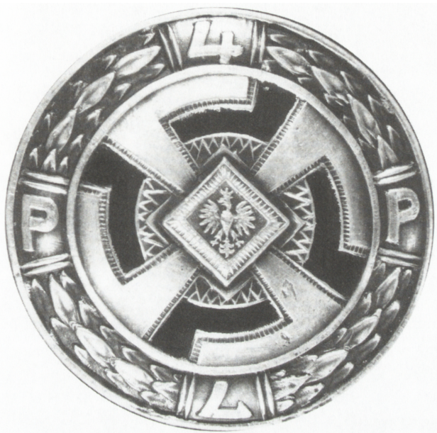
Ryc. 17. Odznaka 4 P.P. Leg., nr inw. MNKi/H/4820

Kolejna grupowa fotografia, która trafia do naszych zbiorów, wykonana została w 1920 roku i przedstawia uczniów i nauczycieli gimnazjum państwowego im. Mikołaja Reja, noszącego później imię Stefana Żeromskiego (MNKi/H/5146). Ekspонат ten wzbogacił liczną kolekcję zabytków związanych z dziejami kieleckiego szkolnictwa.