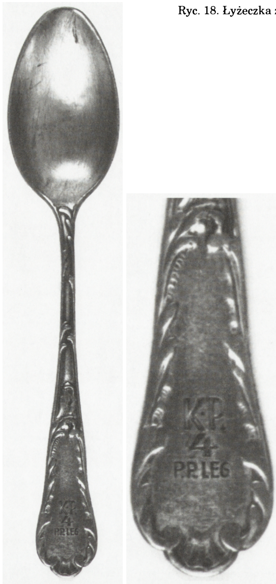
Ryc. 18. Łyżeczka z kasyna 4 PPLeg., nr inw. MNKi/H/5310