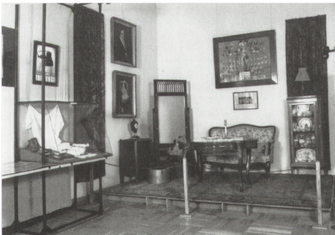
Ryc. 4. Fragment wystawy Pokolenie nadziei. Kielczanie 1918–1939 . Salonik mieszczczyński

Życie gospodarze Kielc reprezentowały na wystawie duże przedsiębiorstwa (np. fabryka marmurów, fabryka „Granat”, Wytwórnia „Społem”, Zakłady Mechaniczne i Odlewnia Żeliwa „Białogon” oraz znana w całym kraju Suchedniowska Fabryka Odlewów i Huta „Ludwików”) i liczne zakłady rzemieślnicze. Żyłostrowano przejawy życia społecznego i kulturalnego – szkolnictwo, kina, teatry, drukarnie, organizacje społeczne i towarzystwa. Zaprezentowano kielczan z „pokolenia nadziei”,