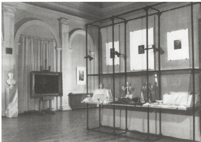
Ryc. 1. Fragment wystawy Sztuka niemiecka. Polska kolonia artystyczna w Monachium . Sala z pokazem rzemiosła artystycznego, grafiki, malarstwa i rzeźby, medalierstwa