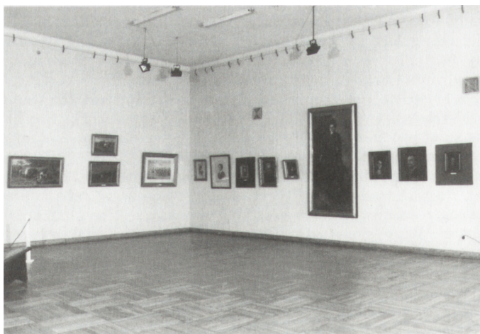
Ryc. 2. Fragment wystawy Sztuka niemiecka. Polska kolonia artystyczna w Monachium . Sala z pokazem malarstwa polskich „monachijczyków”

Drugą część wystawy stanowiło malarstwo „monachijczyków” – artystów polskiego pochodzenia studiujących i tworzących w jednym z europejskich centrów artystycznych – Monachium, zwanym w XIX w. „niemieckimi Atenami”. Przez tamtejszą akademię malarstwa i pracownię prywatne przewinęło się w XIX w. – głównie w latach 1860–1880 – kilkudziesięciu artystów z Polski. Głównym ak-