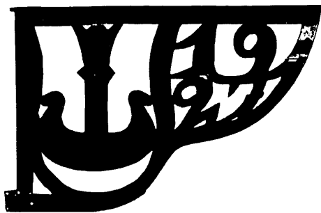
Ryc. 6. Jedna z chorągiewek ze zwieńczenia hełmu wieży pałacu kieleckiego z herbem Korab i datą rekonstrukcji hełmu (oryginał w pałacowym lapidarium)

Wymieniono pokrycie z blachy miedzianej na zachodnich i południowych połaciach dachowych pałacu. Na dachach i wieżach założono instalację odgromową. Wieże otrzymały chorągiewki z blachy miedzianej odtworzone