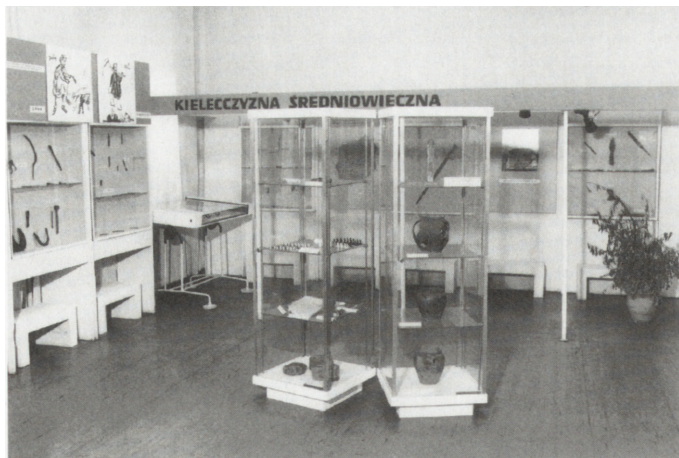
Ryc. 3. Kielecczyzna średniowieczna , fragment wystawy

wacze). Oryginalne eksponaty uzupełniały makietki: figury Światowita ze Zbrucza (oryginał w Muzeum Archeologicznym w Krakowie), kościoła romańskiego w Prandocinie oraz kopia słynnych szachów odnalezionych w Sandomierzu (oryginał w Państwowym Muzeum Archeologicznym w Warszawie).