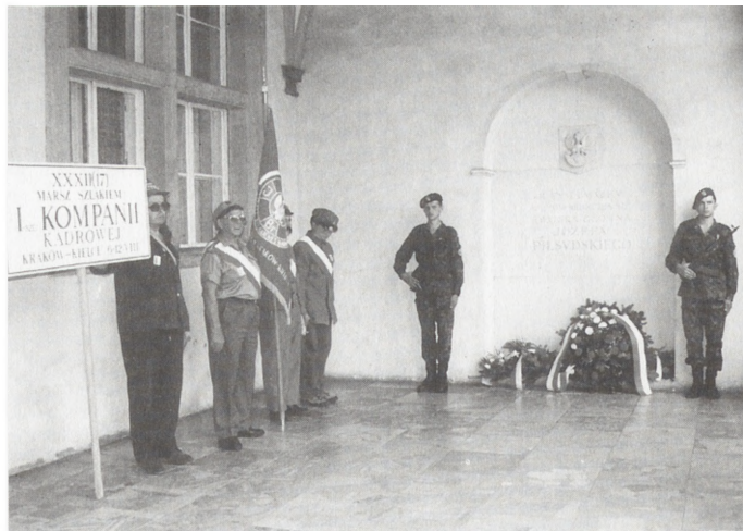
Ryc. 7. Uczestnicy XXXII Marszu Szlakiem Pierwszej Kompanii Kadrowej z Krakowa do Kielc: warta przed tablicą pamiątkową poświęconą Józefowi Piłsudskiemu w loggii pałacu kieleckiego