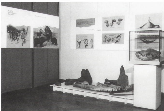
Ryc. 1. Fragment wystawy Z pradziejów regionu świętokrzyskiego , szczątki zwierząt epoki lodowcowej

Interesujące zespoły eksponatów dokumentowały epokę żelaza, m.in.: gliniane popielnice, misy i klosze (kultura grobów kłoszowych) oraz charakterystyczne dla kultury przeworskiej naczynia z grobów i różnorodne wyroby żelazne (miecze, umbra, groty, ostrogi, noże, nożyce, klucze, haczyki, sprzączki, okucia). Dużą rolę w rozwoju kultury mate-