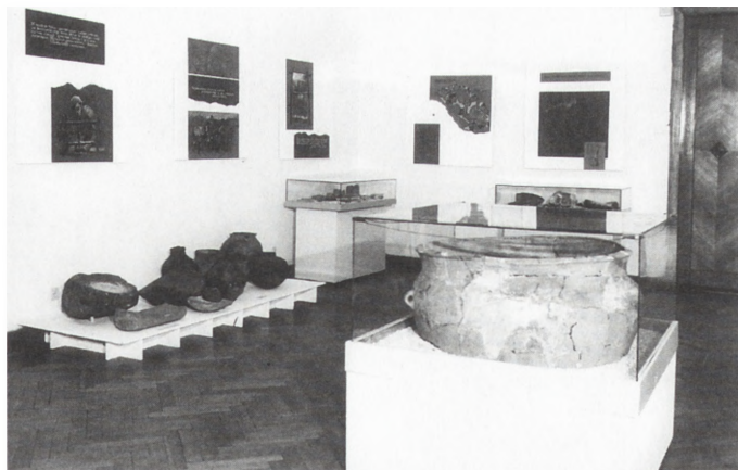
Ryc. 2. Fragment wystawy Z pradziejów regionu świętokrzyskiego , zabytki epoki brązu

rialnej w regionie świętokrzyskim w okresie wpływów rzymskich odegrał ośrodek metalurgii żelaza, po którym pozostały ślady piecowisk i licznych dymarek. Na wystawie pokazano kłoc żuźla oraz wyrobę żelazne: broń i narzędzia. Powszechną uwagę zwracały skarby monet, zwłaszcza unikatowy zbiór 147 denarów z czasów Republiki i cesarza Augusta, odkryty w 1968 r. w Połańcu. Pochodzące z okresu wędrówek ludów (IV-VI w.) cenne znalezisko w Jakuszowicach – wyposażenie grobu książęcego, przechowywane w Muzeum Archeologicznym w Krakowie – pokazano tylko na planszy. W Kielcach eksponowano je przed 30 laty na wystawie Ziemia Kielecka na tle dziejów Słowiańszczyzny (zob. Kronika muzealna 1966 , „Rocznik Muzeum Świętokrzyskiego” t. 4: Kraków 1967, s. 473).