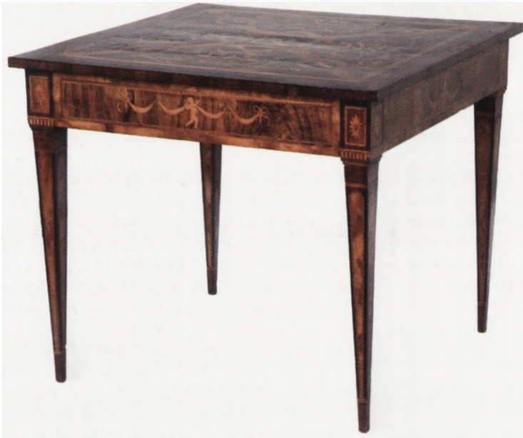
Il. 1. Stół w typie Maggioliniego

Stół klasycystyczny z dekoracją „w typie Maggioliniego”