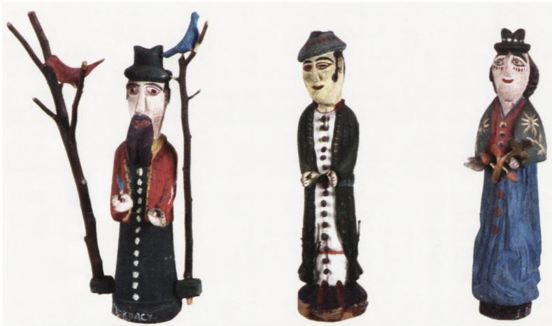
Il. 3, 4, 5. Zimni Ogrodnicy