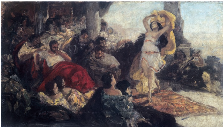
Il. 6, Maurycy Gottlieb. Taniec Salome . Olej, płótno, 37,5 x 67,5 cm, Muzeum Narodowe w Kielcach, nr inw. MNKi/M/195.