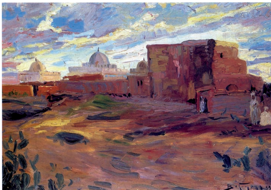
Il. 4, Adolf Behrman. Pejzaż wschodni , 1933. Olej, płótno, 66 x 46 cm, sygnowany w prawym dolnym rogu: Behrman 33 . Żydowski Instytut Historyczny, Warszawa, nr inw. ŻIH/A - 411.