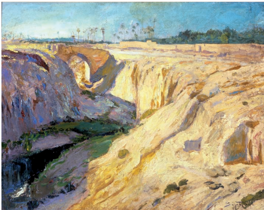
Il. 1, Adolf Behrman. Krajobraz wschodni . Olej, płótno, 67 x 85,5 cm sygnowany w prawym dolnym rogu: Behrman. Żydowski Instytut Historyczny, Warszawa nr inw. ŻIH / A - 439.

studiował w Akademii Sztuk Pięknych do 1904 roku. Lata 1905-1911 spędził w Paryżu – uzupełniał tam wykształcenie, na utrzymanie zarabiał kopiowaniem dzieł starych mistrzów w Luwrze 4 . Odbił wówczas swoją pierwszą podróż po Europie i Afryce Północnej (B. 1927: 535-536). Zwiedził Francję, Hiszpanię, Algier, przewędrował Saharę. Z tego okresu pochodzą nastrojowe portrety, sceny rodzajowe, pejzaże zdradzające wpływy akademizmu monachijskiego, rozjaśnionego jednak światłem i barwą właściwymi dla sztuki postimpresjonistów. Są to m.in. przechowywane w Żydowskim Instytucie Historycznym im. Emanuela Ringelbluma w Warszawie, Aleja w Wersalu , Przed lustrem , Portret kobiety oraz prezentowany w łódzkim Domu Aukcyjnym „Rynek Sztuki” Zachód słońca nad morzem (www.artinfo.pl, 2004: 06.05.). Jedynym śladem po pobycie w Afryce jest znany tylko z tytułu obraz Pejzaż z Algierii , wystawiony w Łodzi w 1918 roku.