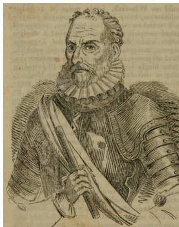
Il. 5, Aleksander Gwagnin.

Aleksander Gwagnin, właśc. A. Guagnini (1534-1614) historyk, rotmistrz, kupiec. Urodził się w Weronie, do Polski przybył z ojcem w 1558 roku, gdzie jako znawcy sztuki fortyfikacyjnej i oblężniczej brali udział w wojnie moskiewskiej w latach 1563-1569. Aleksander był dowódcą obrony twierdzy w Witebsku. Za zasługi wojenne otrzymał w 1571 roku indygenat, czyli prawo obywatelstwa przyznawane cudzoziemcom, a potem tytuł szlachecki. Uczestniczył w wyprawach króla Stefana Batorego pod Gdańsk (1576), Wielkie Łuki (1580) i Psków (1581). W 1578 roku dedykował i ofiarował Batoremu pierwsze łacińskie wydanie Sarmatiae Europaeae descriptio (...) , które odegrało wówczas ważną rolę propagandową w rokowaniach na rzecz Rzeczypospolitej. Wyjeżdżał do Włoch w celach handlowych chcąc zorganizować bezpośredni wzajemny handel między Włochami a Polską. Zmarł w Krakowie, gdzie mieszkał od zakończenia działalności wojskowej.