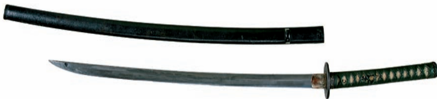
Il. 1, Miecz – katana, XVIII-XIX w.