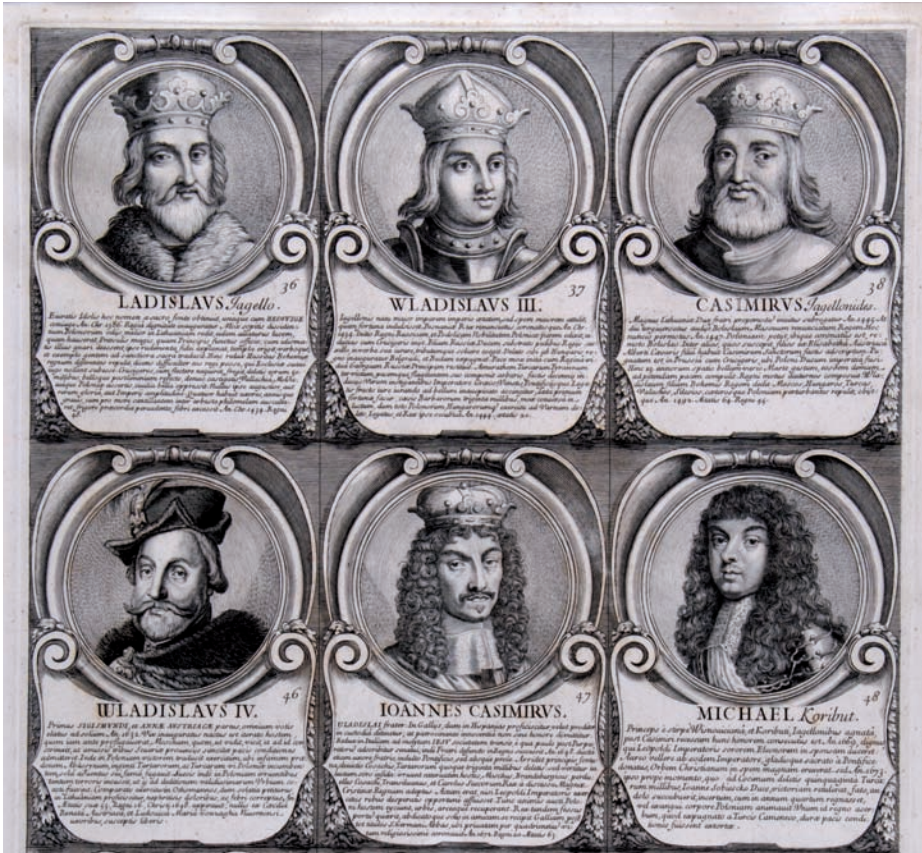
Il. 1, Portrety królów polskich i książąt polskich „Series chronologica Ducum et Regum Polonorum a Lacho I. ad Augustum II”.