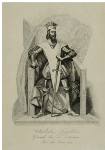
Il. 2, Władysław Jagiełło.

Wizerunek pochodzi z drugiego tomu (s. 48) znanego wydawnictwa Leonarda Chodźki, do którego ilustracje wykonał Antoni Oleszczyński. Wznawiana kilkakrotnie, napisana w języku francuskim i bogato ilustrowana książka przedstawiała historię Polski i jej kulturę. Jagiełło ukazany w pełnej postaci stoi na tle tronu, ubrany w zbroję, wsparty jedną ręką na mieczu, okryty charakterystycznym płaszczem, nakładanym od góry, tworzącym z tyłu obfite draperie. Zwróconą w prawo głowę wieńczy korona, spod której opadają długie proste włosy. Podłużną twarz okrywa broda i długie opadające włosy. W ikonografii króla nie spotykamy podobnych przedstawień zdominowanych przez symbolikę rycerską, zazwyczaj oprócz miecza trzyma inne akcesoria władzy np. jabłko czy berło. Z jego wcześniejszymi wizualizacjami łączy się natomiast forma płaszcza naśladowującego krojem antyczną penulę, którą stanowił płat tkaniny z otworem na głowę. W tym przypadku zniekształcono go „barokowymi” draperiami. Po raz pierwszy w podobnym stroju przedstawili króla artyści bizantyjscy na wspomnianych malowidłach z kaplicy św. Trójcy na zamku w Lublinie. Twarz władcy odbiega od utrwalonego w sztuce typu wywodzącego się od nagrobka w katedrze wawelskiej, przypomina raczej ten z pieczęci majestatowej. Znajomość tego zabytku przez Antoniego Oleszczyńskiego potwierdzają wykonane przez niego realistycznie staloryty odtwarzające odcisk pieczęci z Biblioteki Narodowej w Warszawie: G 14064, G.14094, 1825-1850.