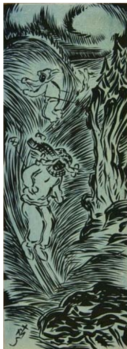
Il. 1, Para narciarzy , 1963.

Scena zjazdu pary narciarzy została potraktowana dynamicznie z podkreśleniem sportowej postawy dziewczynki na pierwszym planie. Pochyla się do przodu na ugiętych w nogach, z uniesionymi wysoko, skierowanymi do tyłu kijkami narciarskimi. Pęd wiatru unosi jej warkocze z kokardami i rozwija długi, kraciasty szal. Jej narty pozostawiają za sobą długi ślad w postaci strumienia linii, uwydatniający ruch. Ma na sobie dwuczęściowy sportowy strój i wełnianą czapkę na głowie. Powyżej niej, narciarz ukośnie przecina stok odpychając się mocno kijkami, za nim w oddali zarysowana mała sylwetka innego zjeżdżającego. Narciarz ma dwuczęściowy strój i czapkę przypominającą tyrolski kapelusik. Z prawej strony kompozycji stoi pojedyncze drzewo, za którym widać wierzchołki świerków porastających strome zbo-