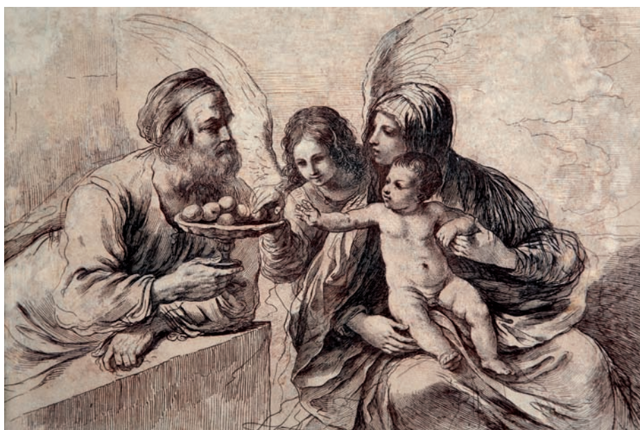
Il. 1, Święta Rodzina z aniołem , 1764.