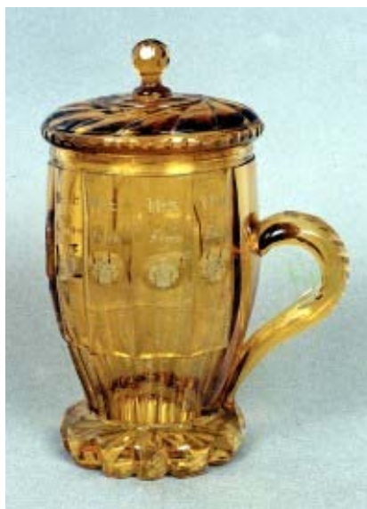
Il.1, Kufel z genealogią rodu Potockich i monogramem J.P.