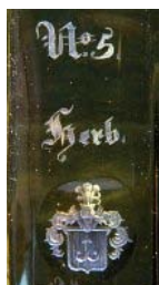
5. Herb Kalinowa