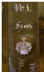
1. Herb Mniszech