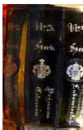
4. Herb Śreniawa