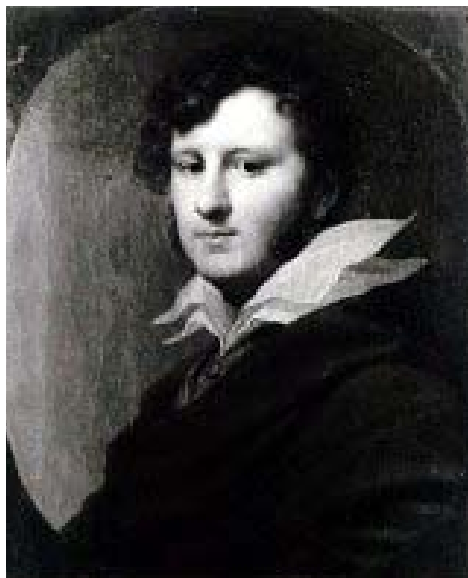
Il. 3, Portret Jarosława Potockiego (zaginiony) autorstwa Jana Chrzyciela Lampi.