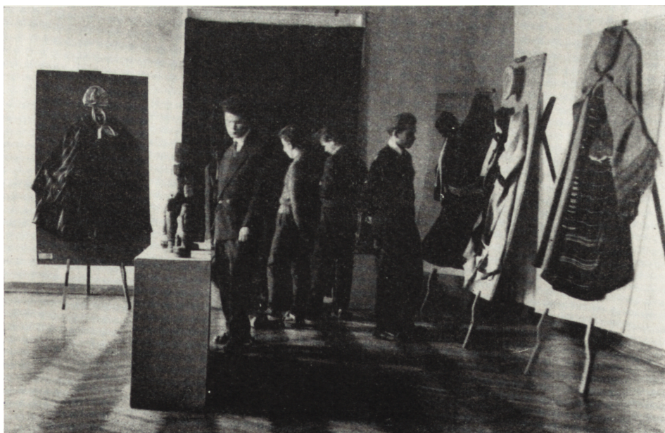
Fragment wystawy Sztuka ludowa województwa kieleckiego (listopad 1958 r.)

Strój kobiecy został skompletowany w kilkunastu odmianach. Ciekawie przedstawiał się zbiór kilimów i innych tkanin z różnych stron regionu, a więc o różnych raportach, w których dominują surowe, ciemne barwy, charakterystyczne dla Puszczy Radomskiej. Na uwagę zasługują piękne wyroby kowalskie z Bierwiec: okucia do wozów i drzwi, zawiasy, lichtarze i inne. Duże trudności stwarza gromadzenie narzędzi pracy, sprzętu, a nawet stroju męskiego, którego fragmenty zachowały się jedynie w kilku miejscowościach. Łącznie zebrano około 200 eksponatów, które pozwalają na stworzenie samodzielnej ekspozycji, niemniej dział ten wymaga jeszcze długoletnich badań, wytrwałych uzupełnień, dalszych zakupów i opracowań.