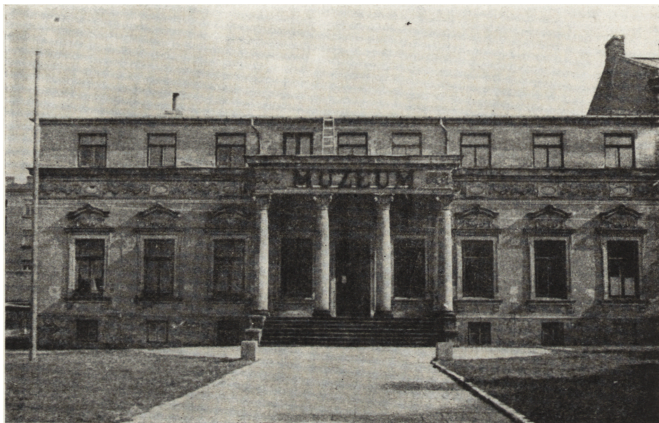
Gmach Muzeum Regionalnego w Radomiu przy ul. Nowotki 12

stare grzejniki oraz kocioł. Przewody elektryczne zainstalowano w ścianach, podłogi z surowych sosnowych desek zastąpiono parkietami.