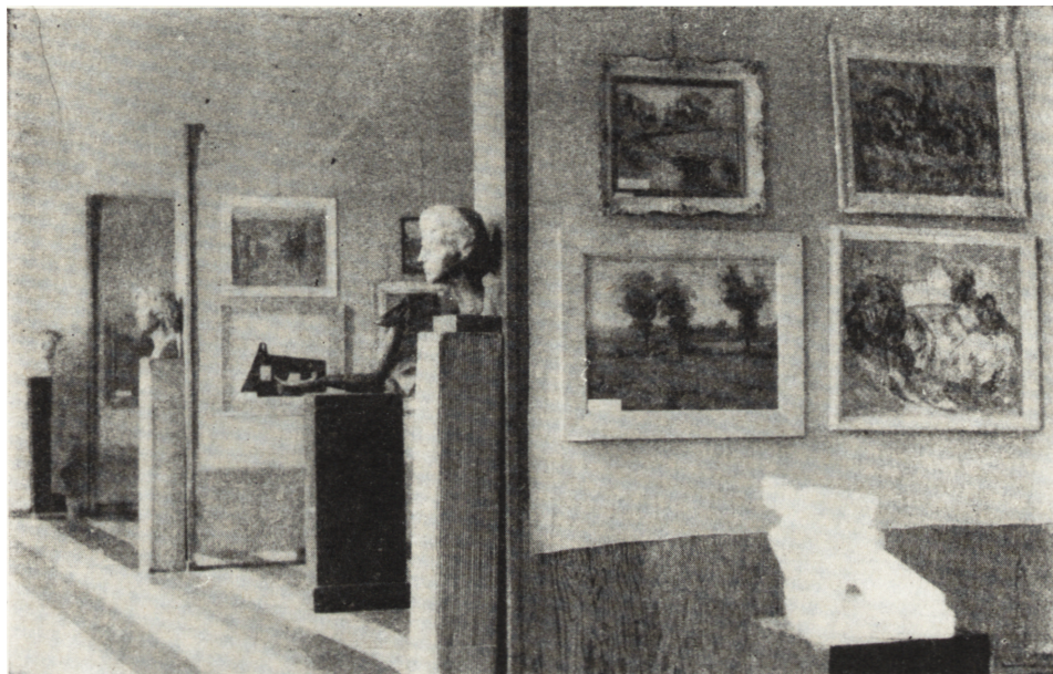
Fragment ekspozycji XIV Ogólnopolskiej Wystawy Plastyki (grudzień 1958— luty 1959)

krzyskie w Kielcach. Dotyczą one przeważnie okresu wcześniejszego. Są to dzieła M. Bacciarellego, J. Lampiego, J. Grassiego, P. Norblina, P. Michałowskiego i innych 24 . Reakcja społeczeństwa jest dowodem, że tego rodzaju ekspozycja była w środowisku radomskim bardzo pożądana. Zainteresowanie jest duże, a wyraża się w stale wzrastającej frekwencji.