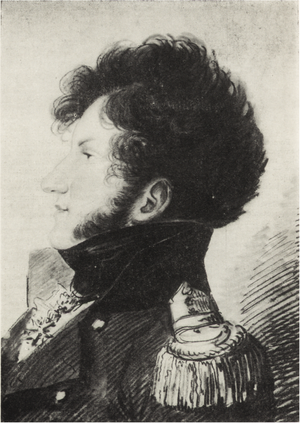
Ryc. 1. Aleksander Orłowski Portret młodzieńca w mundurze maltańskim , pastel, pap.