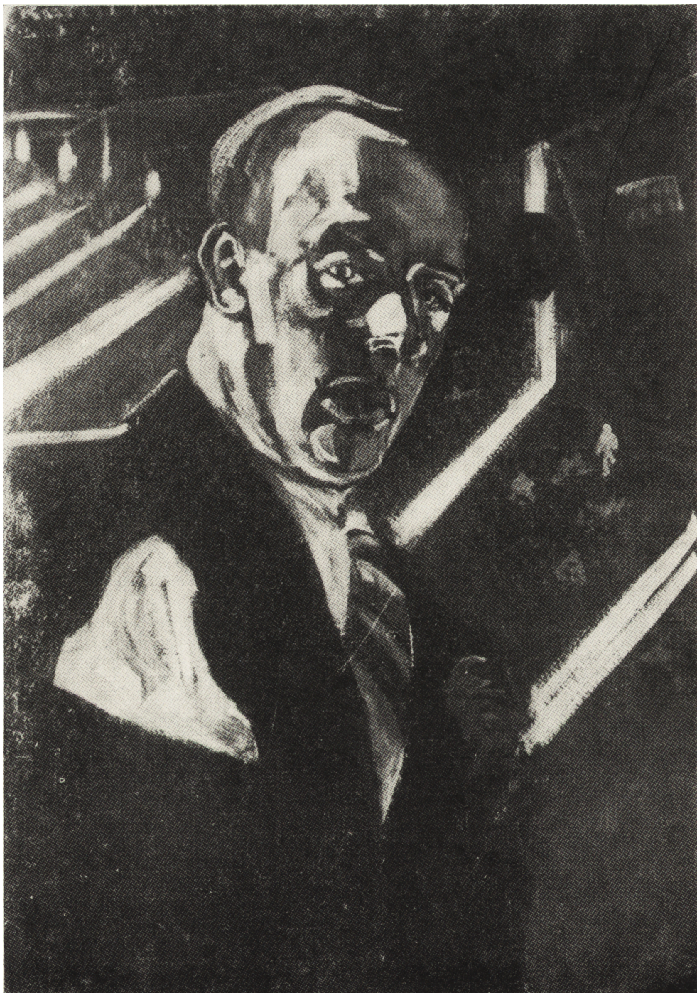
Ryc. 8. Rafał Malczewski Autoportret alegoryczny , temp., ol., tektura