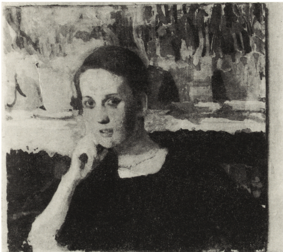
Ryc. 6. Witold Wojtkiewicz Portret Pani M. R. , temp., pl.

kim jego koloryt, utrzymany w soczystym zielonkawo-perłowym tonie, podczas gdy Wieś Białogon posiada może zbyt ciemny, „muzealny” koloryt. Płótno Maleckiego wzbogaca ciekawą kolekcję polskiego malarstwa krajobrazowo-rodzajowego.