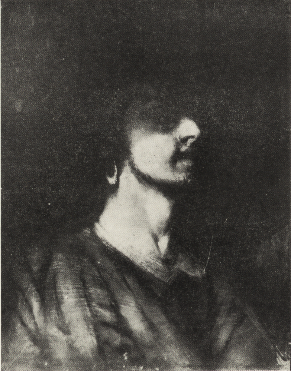
Ryc. 5. Maurycy Gottlieb Portret młodego Żyda , ol., deska

i atmosferze, jak też w prawdzie przedstawienia posiada wiele cech wspólnych z pejzażem ze zbiorów Muzeum Narodowego w Poznaniu, pochodzącym z tego samego roku, a związanym również z Kielecczyną — zatytułowanym Wieś Białogon . To, co różni obraz kielecki poza tematem, to przede wszystkim