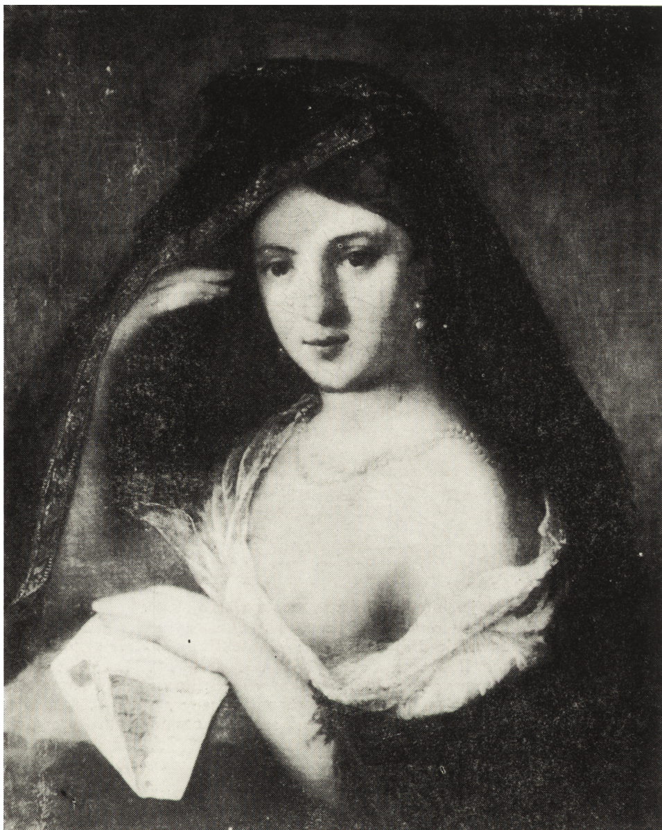
Ryc. 2. Franciszek Pfanhauser Portret damy w szalu , ol., pł.

Obraz przedstawiający nieznaną damę wykazuje w stylu i potraktowaniu postaci cechy innych portretów kobiecych tego artysty z drugiej połowy lat trzydziestych XIX wieku. Ciemny koloryt utrzymany jest w tonacji brązowej. Starannie malowane szczegóły unaoczniają zamiłowanie malarza do dekoracyjności, a wydobyty za pomocą światła modelunek torsu — skłonność