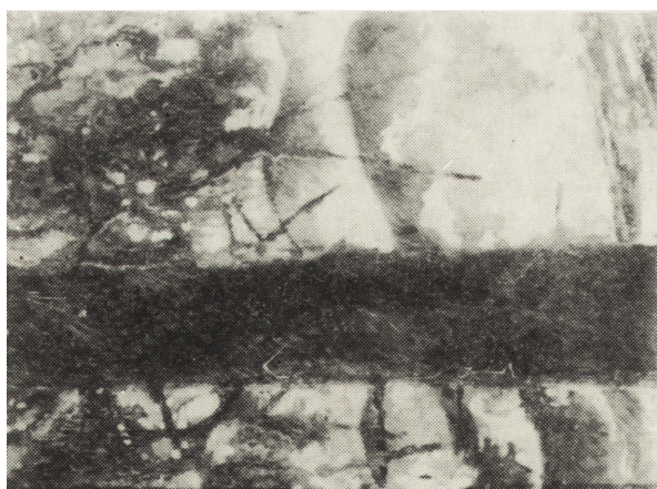
Ryc. 7. Kazimierz Sichulski Na Prucie , ol., karton