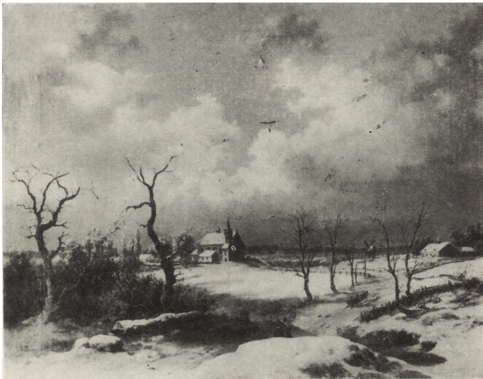
Ryc. 3. Franciszek Kostrzewski Pejzaż zimowy , ol., pł.

artysty do plastycznej syntezy. Zbliżony do analizowanego jest portret kobiety publikowany w Albumie sztuki polskiej 1 .