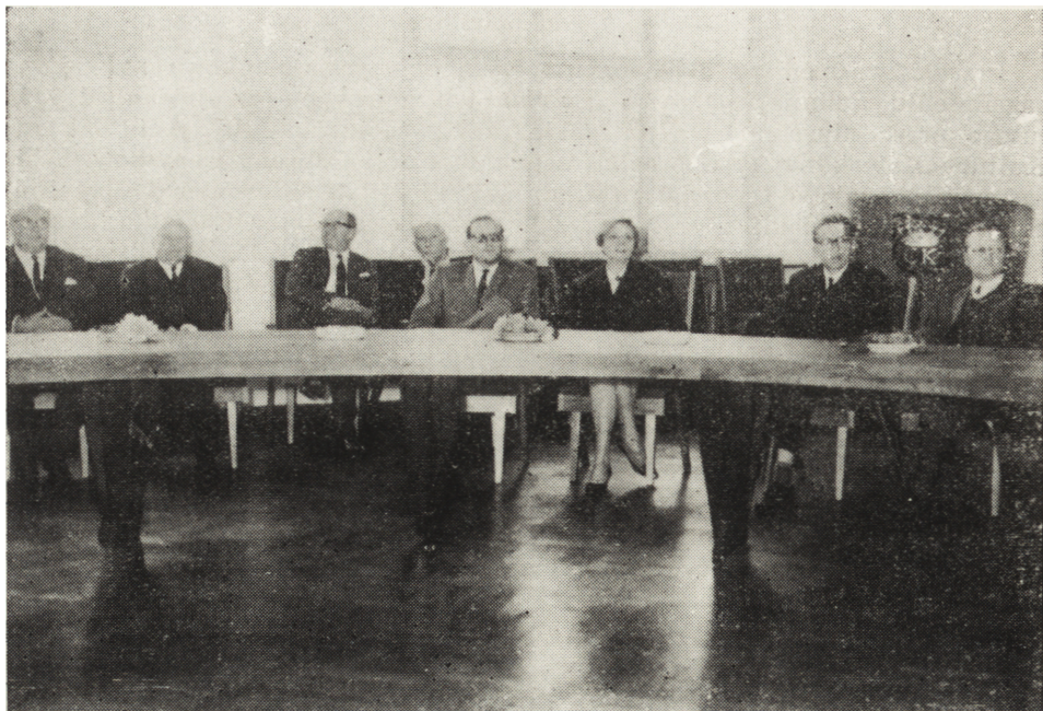
Ryc. 2. Uczestnicy uroczystości inauguracyjnych II Międzynarodową Kampanię Muzealną w sali portretowej zamku kieleckiego