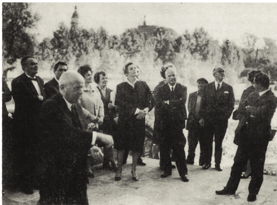
Ryc. 3. Uczestnicy uroczystości inauguracyjnych II Międzynarodową Kampanię Muzealną w czasie zwiedzania Szydłowca

Kieleccyzna jeszcze raz, w dniu 4 listopada, gościła uczestników II Międzynarodowej Kampanii Muzealnej. Wówczas to pierwszym zwiedzanym obiektem było rozbudowujące się Państwowe Muzeum im. Przypkowskich