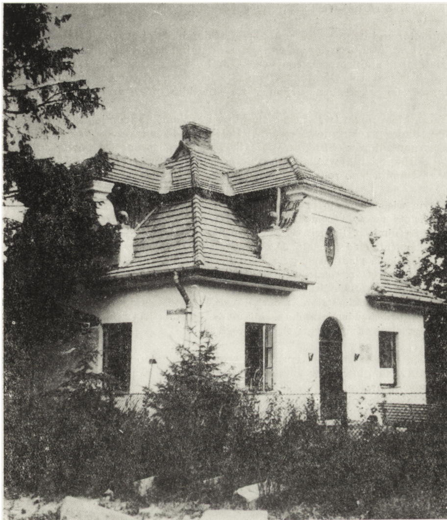
Ryc. 1. Siedziba Muzeum Ziemi Sandomierskiej