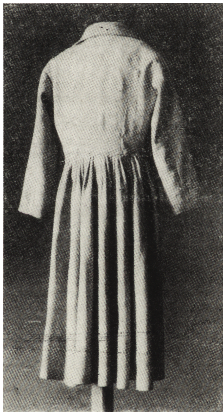
Ryc. 6 i 7. Sukmana sandomierska