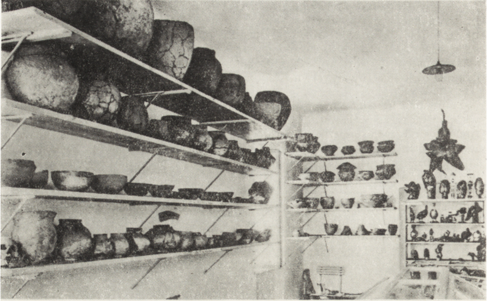
Ryc. 2. Fragment wystawy archeologicznej Muzeum Ziemi Sandomierskiej

Uzyskane zabytki przekazywał do muzeum. Wielkim osiągnięciem w jego pracach wykopaliskowych było odkrycie grobu rzymskiego na Krakówce koło Sandomierza. Grób ten, eksponowany w dzisiejszym muzeum, jest jednym z najciekawszych zabytków obecnej ekspozycji archeologicznej. Obok wspomnianego grobu muzeum posiadało bardzo cenny zbiór ceramiki wczesnośredniowiecznej.