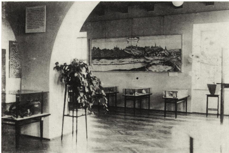
Ryc. 4. Fragment wystawy archeologicznej z roku 1958

zwierząt kopalnych, które przedstawiają zwierzęta najstarszego okresu w dziejach kultury ludzkiej. Młodszy epok kamienia, neolit, bogato reprezentuje ceramika sznurowa grupy złockiej, jak również narzędzia codziennego użytku: siekierki, toporki oraz zestaw pokazujący poszczególne procesy powstawania narzędzi z krzemienia.