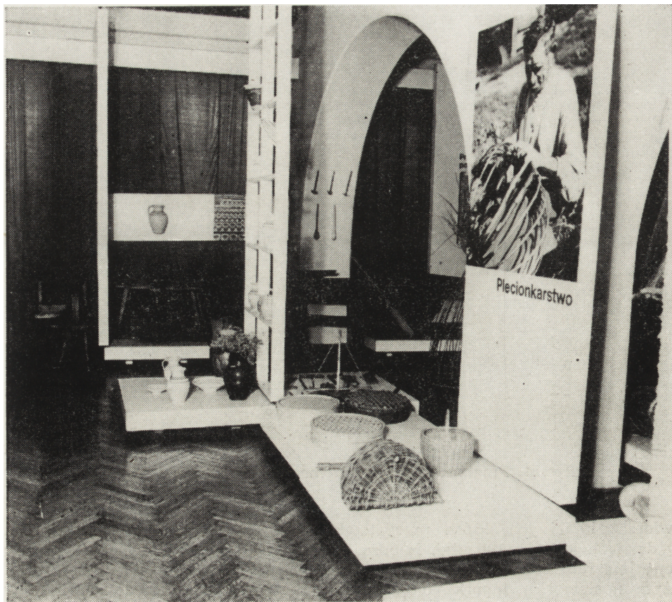
Ryc. 5. Fragment wystawy etnograficznej

2. skarb monet wczesnośredniowiecznych z Gnieszowic, pow. Sandomierz, ilustrujący stosunki gospodarcze okresu wczesnopiastowskiego;