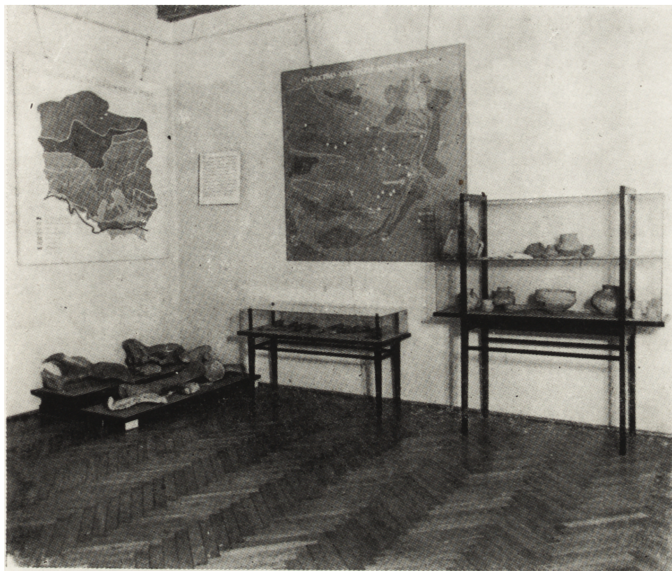
Ryc. 8. Fragment ekspozycji archeologicznej

Brak zaplecza magazynowego, jak też braki finansowe były powodem, że nowo organizowane muzeum nie mogło gromadzić własnego materiału do urządzania wystaw czasowych. W związku z tym kierownictwo muzeum szukało kontaktów z innymi muzeami, które mogłyby wyposażyć i urządzić tutaj atrakcyjne wystawy.