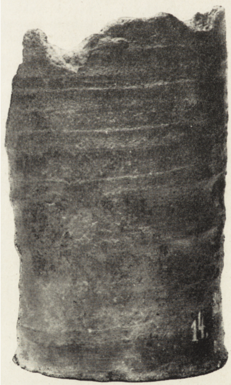
Ryc. 1. Łęgonice. Kafel garnkowy

Spora część tułowia i brzegu wylotu kafla nie zachowały się (ryc. 2).