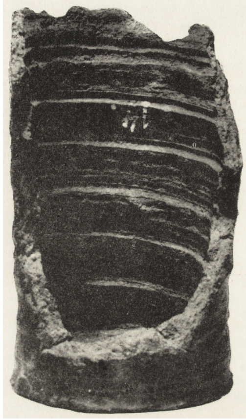
Ryc. 2. Łęgonice. Kafel garnkowy

Długość kafla w obecnym stanie zachowania wynosi 14 cm, średnica dna — 9 cm, grubość ścianki tułowia w części przydennej — 1 cm, grubość ścianki w partii przywylotowej — 0,5 cm.