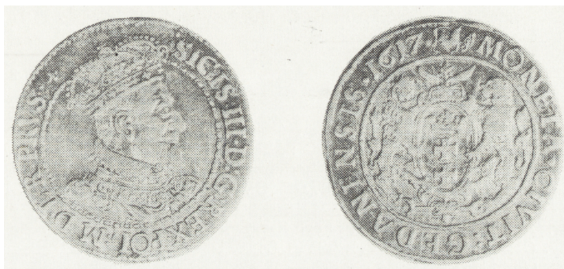
Ryc. 2. Ort gdański z 1617 r., awers i rewers (poz. inw. 2)