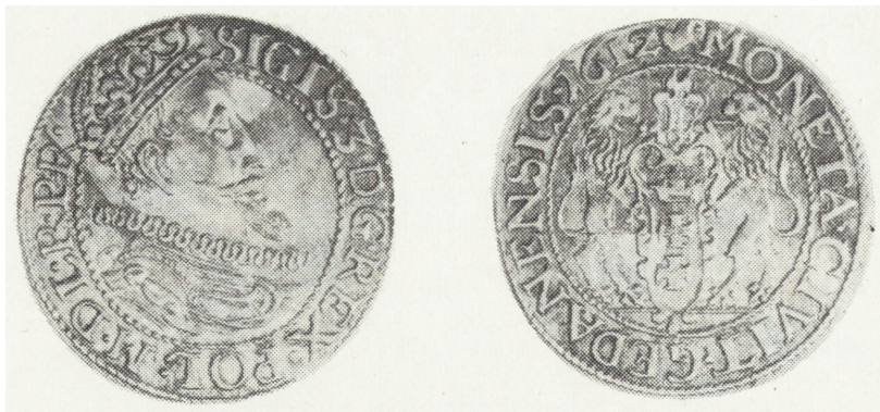
Ryc. 1. Ort gdański z 1612 r., awers i rewers (poz. inw. 1)