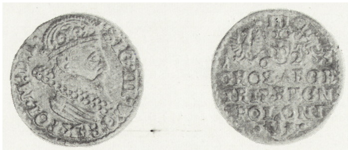
Ryc. 7. Trojak koronny z 1623 r., awers i rewers (poz. inw. 56)