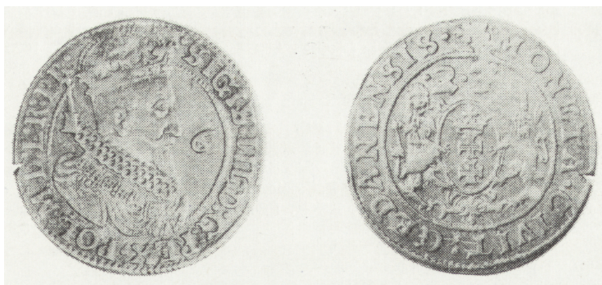
Ryc. 3. Ort gdański z 1623 r., awers i rewers (poz. inw. 3)