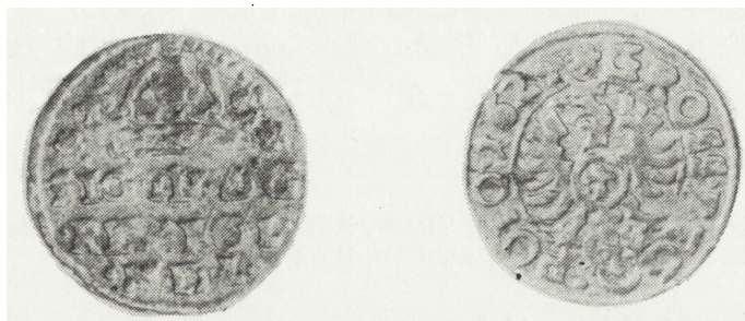
Ryc. 9. Grosz koronny z 1624 r., awers i rewers (poz. inw. 140)