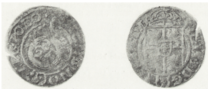
Ryc. 8. Półtorak koronny z 1622 r., awers i rewers (poz. inw. 89)