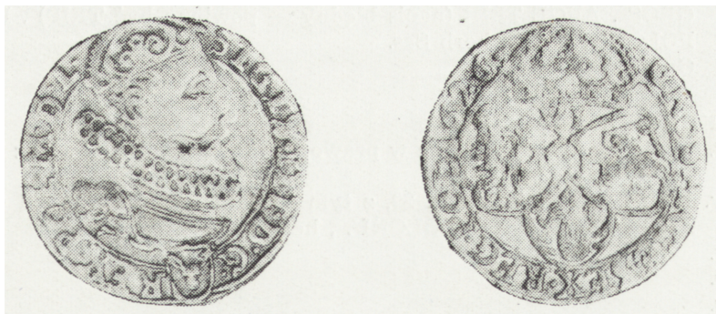
Ryc. 6. Szóstak koronny z 1626 r., awers i rewers (poz. inw. 25)