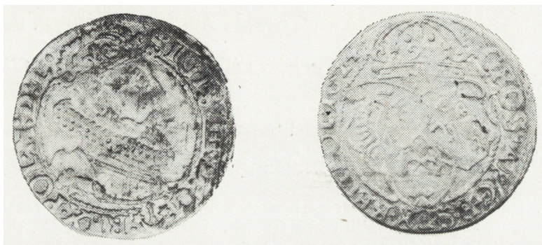
Ryc. 5. Szóstak koronny z 1624 r., awers i rewers (poz. inw. 14)