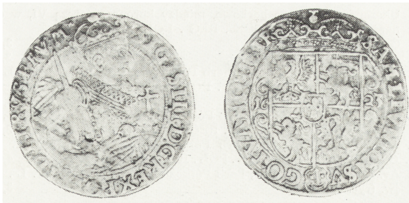
Ryc. 4. Ort koronny z 1623 r., awers i rewers (poz. inw. 8)