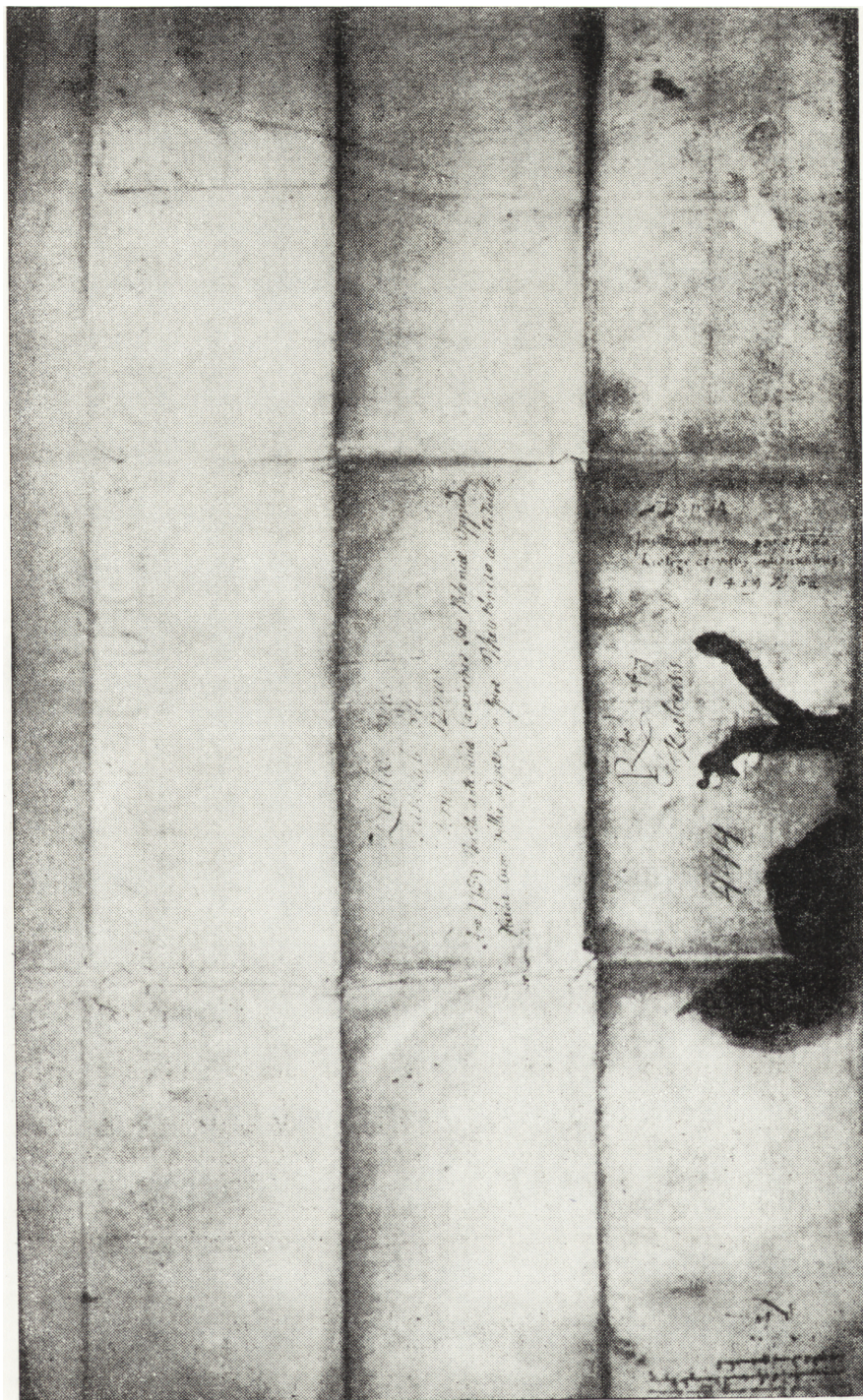
Ryc. 2. Przywilej Kazimierza Jagiellończyka dla Kielc z 12 grudnia 1459 r. (rewers)