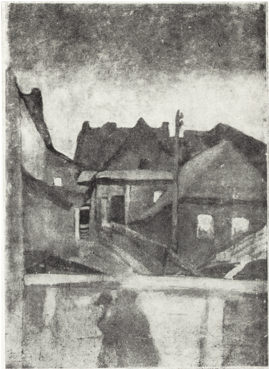
Ryc. 2. St. Czajkowski Szabas w Sandomierzu , poz. wykazu 1