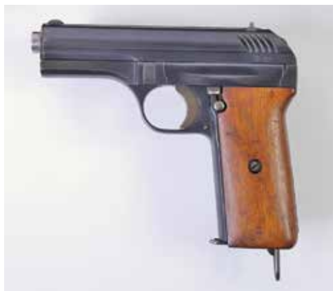
Ryc. 2. Pistolet Česka Zbrojovka wz. 28 – zbiory Muzeum Wojska w Pradze

Służba w ochronie granic była służbą ciężką. Pełna dyspozycyjność obejmowała także czas poza służbą – kiedy strażnicy pełnili funkcje instruktorów Przysposobienia Wojskowego czy Związku Strzeleckiego albo wykonywali inne rodzaje aktywności społecznej. W dłuższym przedziale czasowym organizm nawet najbardziej odpornych – protestował. Pojawiały się objawy wyczerpania. Każdy ze strażników miał prawo do urlopu wypoczynkowego. Korzystali z nich także strażnicy pełniący służbę na posterunku w Ostrowi Maz. co zostało odnotowane w treści rozkazów. W okresie od 1 do 28 czerwca 1936 r. zaplanowano urlop wypoczynkowy Antoniego Domińskiego 33 a „...w czasie od dnia 16 czerwca do dnia 13 lipca rb.” zaplanowano 4-tygodniowy urlop wypoczynkowy str. Dygasa 34 . Wg planu urlopów – w okresie od 10 sierpnia do 7 września 1936 r. – przewidziano urlop wypoczynkowy st. str. Osowickiego 35 . Niedostatek dokumentów nie pozwala jednak na stwierdzenie czy z urlopów tych skorzystali.