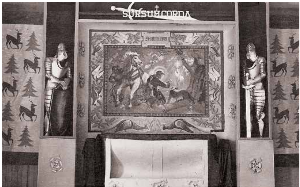
Ryc. 17. Zdjęcie obrazu Św. Hubert umieszczonego w ołtarzu kaplicy obozowej w Oflagu XVIII A Lienz, namalowany przez ppor. E. Czarneckiego.