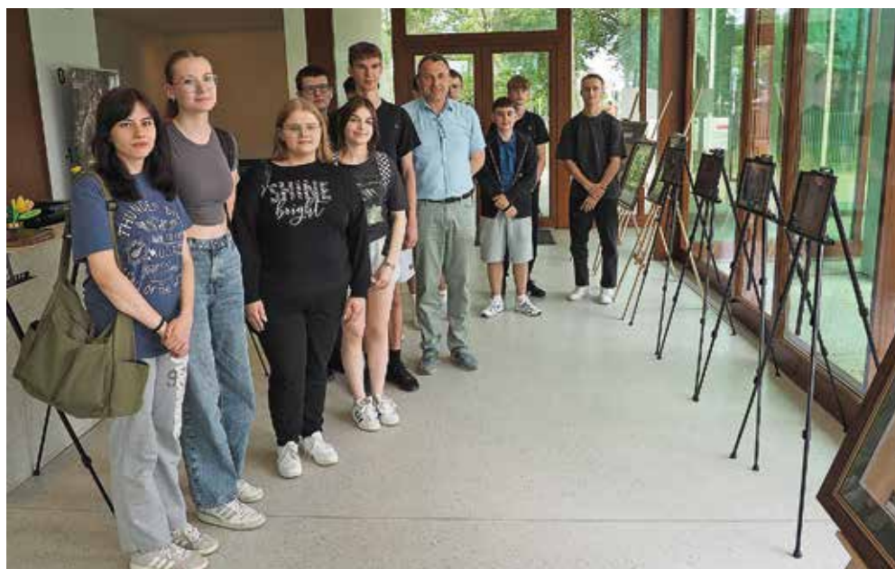
Ryc. 2. Młodzież podczas zwiedzania wystawy w Muzeum