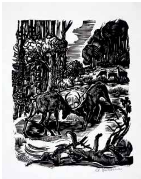
Ryc. 8. Drzeworyt Stanisława Żukowskiego Walka jeleni na leśnej polanie.

rowane przyrodą i łowiectwem. Ukoronowaniem działalności naukowej, dydaktycznej oraz propagandowej leśników i myśliwych okazała się Wystawa Leśna urządzona we wrześniu 1943 r. Wyodrębniono na niej trzy działy: hodowlę, urządzenie i użytkowanie lasu, łowiectwo, które pokazano na 16 m.b. ścian. Ekspozycję zwiedziło ponad 12 000 osób, w tym ok. 150 oficerów i podoficerów niemieckich.