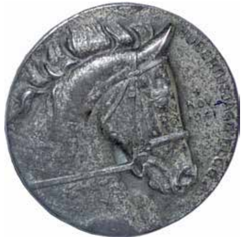
Ryc. 10-11. Żetony biegów hubertowskich zorganizowanych w obozach internowania w Elgg przez polskich i szwajcarskich oficerów w 1941 i 1942 r.