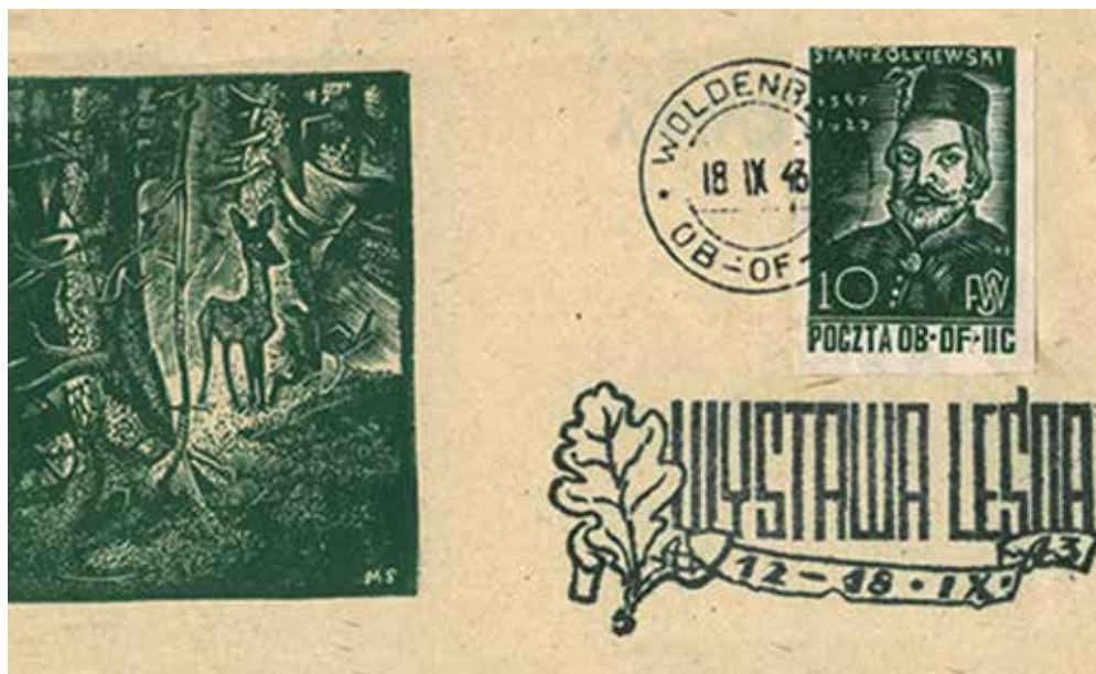
Ryc. 7. Pocztaówka z drzeworytem M. Stępnia wydana z okazji Wystawy Leśnej w Oflagu II C.