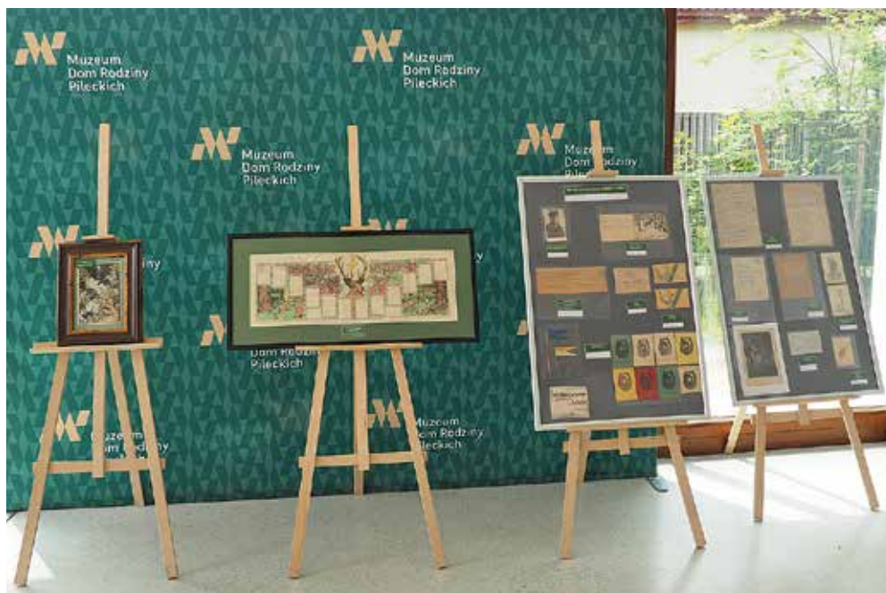
Ryc.1. Fragment wystawy w Muzeum Dom Rodziny Pileckich w Ostrowi Mazowieckiej