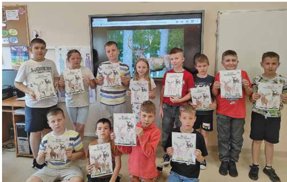
Ryc. 6. Realizacja zajęć projektu „Sarna Nie Jest Żoną Jelenia” w Szkole Podstawowej im. M. Konopnickiej w Starym Zakrzewie w ramach III FKŁ w Ostrowi Mazowieckiej.

Ambitne założenia projektu polegały na wyprodukowaniu i dostarczeniu do wszystkich szkół podstawowych powiatu ostrowskiego oraz kilku w sąsiadujących powiatów kart edukacyjnych z wizerunkami i opisami jelenia, sarny, wilka i bażanta. Łącznie do 40 szkół podstawowych trafiło ok. 35 tysięcy kart edukacyjnych, w kompletach przeznaczonych dla ponad 8000 uczniów i pedagogów a niezwykle kreatywne zajęcia z ich wykorzystaniem rozpoczęły się jeszcze przed samym Festiwałem, co wiele szkół prezentowało w swoich mediach społecznościowych.