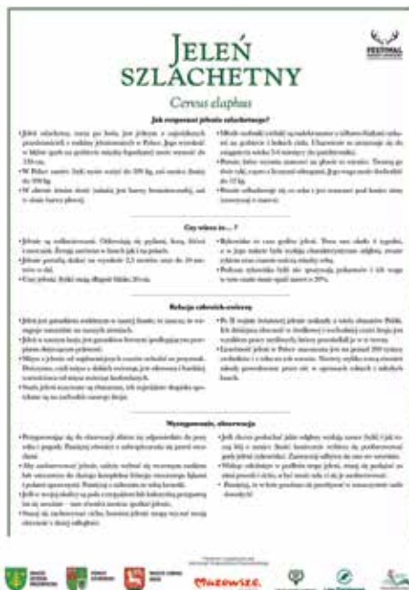
Ryc. 2-3. Wzór kolorowanek i kart edukacyjnych.