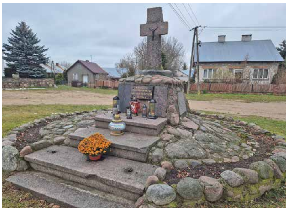
Ryc. 9-11. Pomnik pomordowanych w Nurze 4 sierpnia 1944 roku