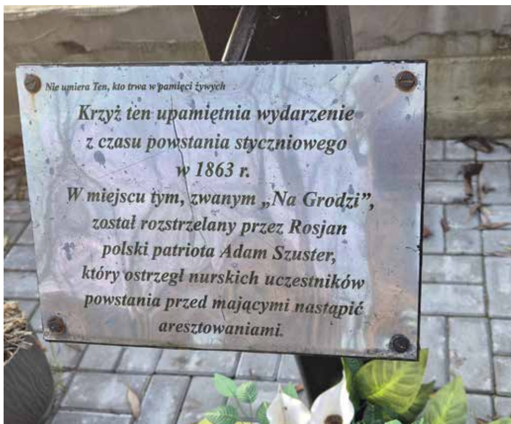
Ryc. 7-8. „Krzyż na Grodzi”