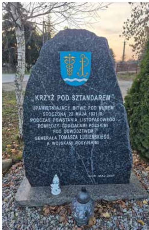
Ryc. 1-2. „Krzyż pod Sztandarem”