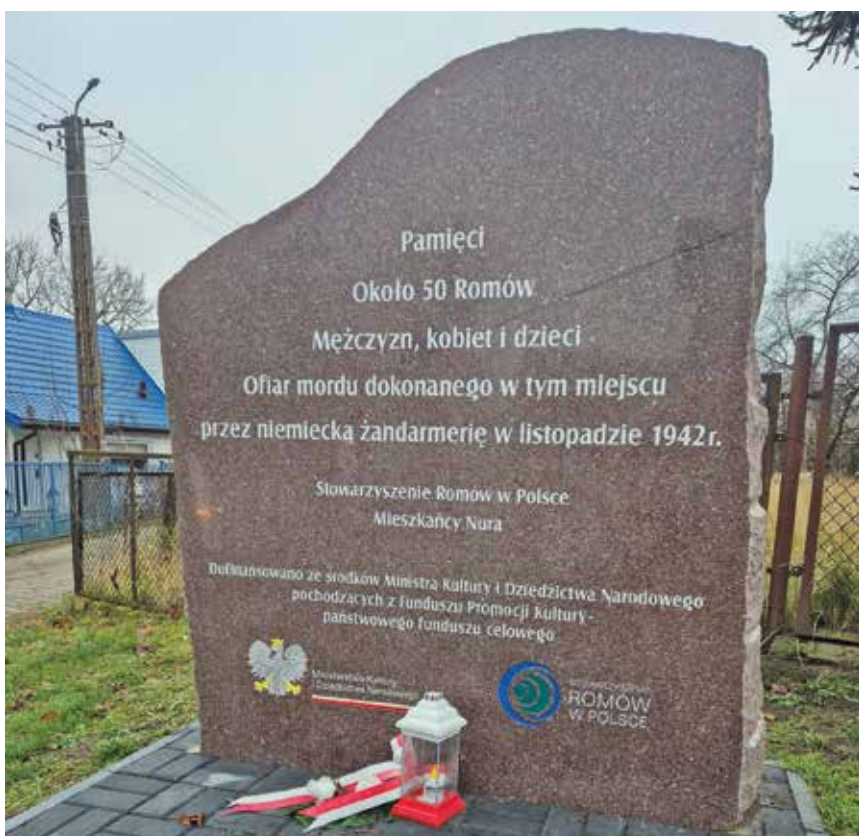
Ryc. 12. Pomnik Pomordowanych Romów w Nurze

Dnia 19 grudnia 2024 r. miała miejsce uroczystość odsłonięcia pomnika upamiętniającego ofiary narodowości romskiej. To wydarzenie było możliwe dzięki zaangażowaniu i determinacji Stowarzyszenia Romów w Polsce, które zrealizowało ten projekt ze środków Ministerstwa Kultury i Dziedzictwa Narodowego w ramach programu „Miejsca pamięci i trwale upamiętnienia w kraju”. W uroczystości uczestniczyły władze Gminy Nur, przedstawiciele stowarzyszeń mniejszości romskiej oraz przedstawicielka Oddziałowego Biura Upamiętniania Walk i Męczeństwa Instytutu Pamięci Narodowej Oddział w Białymstoku.