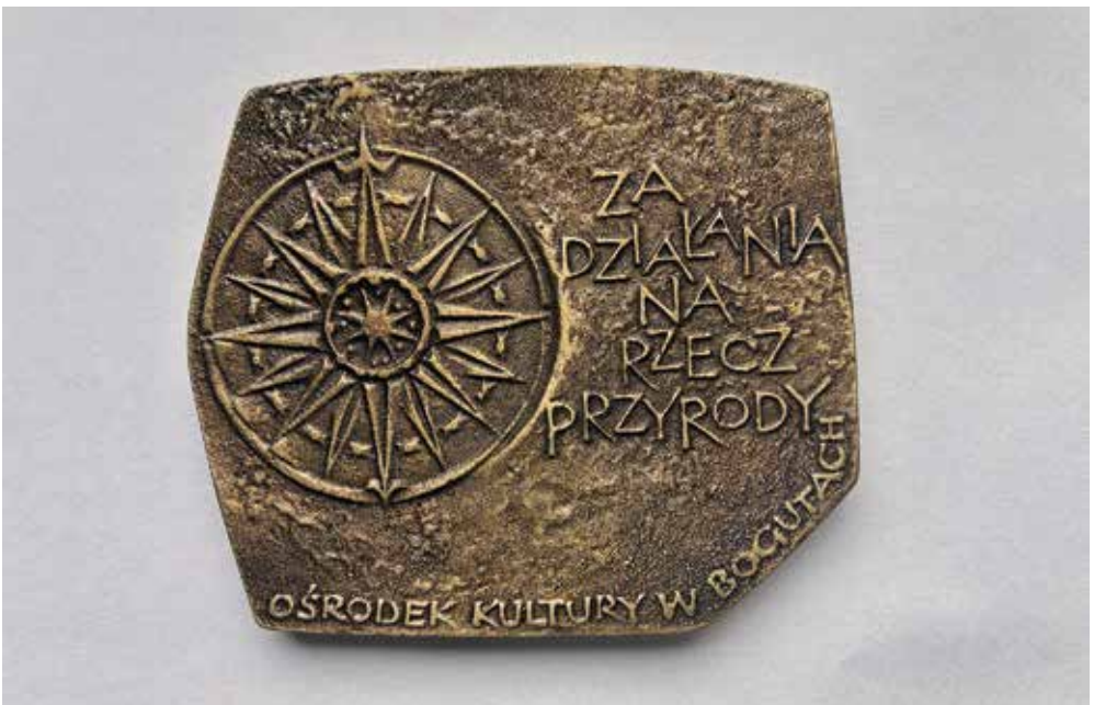
Ryc. 9. Po lewej stronie róża kompasowa tzw. „Róża Wiatrów”. Po prawej napis: ZA DZIAŁANIA NA RZECZ PRZYRODY. U dołu po obrzeżu: OŚRODEK KULTURY W BOGUTACH