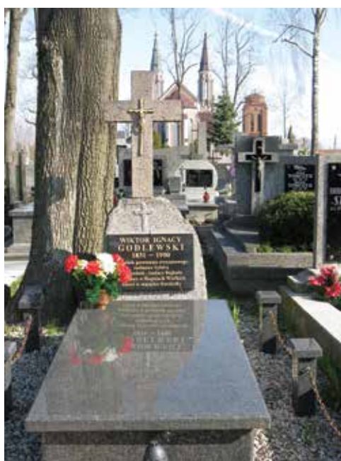
Ryc. 6-7. Grób Wiktora Ignacego Godlewskiego na cmentarzu parafialnym w Jasienicy (w 2009 r. Gmina Ostrów Mazowiecka i mieszkańcy Jasienicy ufundowali nową płytę nagrobną)