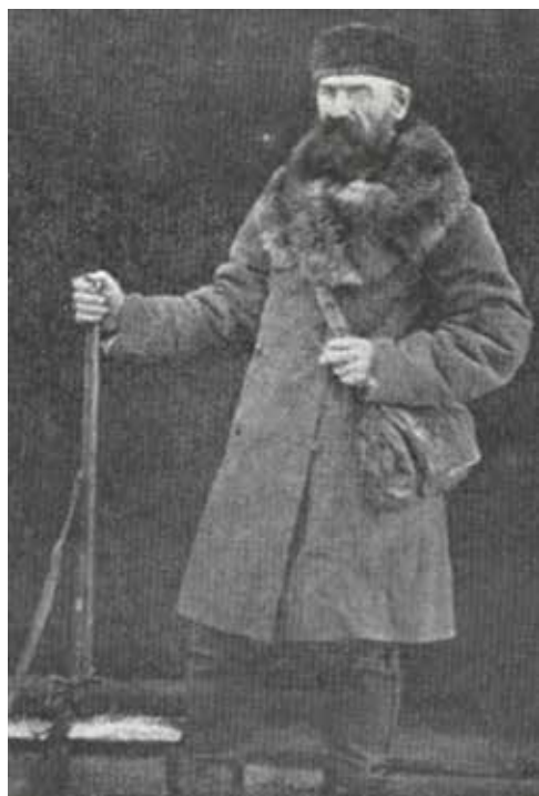
Ryc. 2. Wiktor Ignacy Godlewski na Syberii

Pomimo planów nie zdążył swych myśli i obserwacji zebrać na piśmie. Zmarł nagle na tyfus, w swoim majątku Smolechy, 17 listopada 1900 r. Został pochowany na cmentarzu parafialnym w Jasienicy.