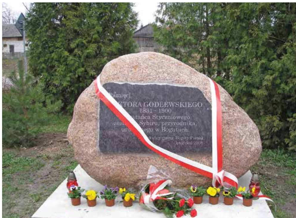
Ryc. 5. Głaz pamiątkowy poświęcony pamięci Wiktora Godlewskiego odsłonięty przed Gminnym Ośrodkiem Kultury i Sportu w Bogutach-Piankach 14 kwietnia 2008 r.