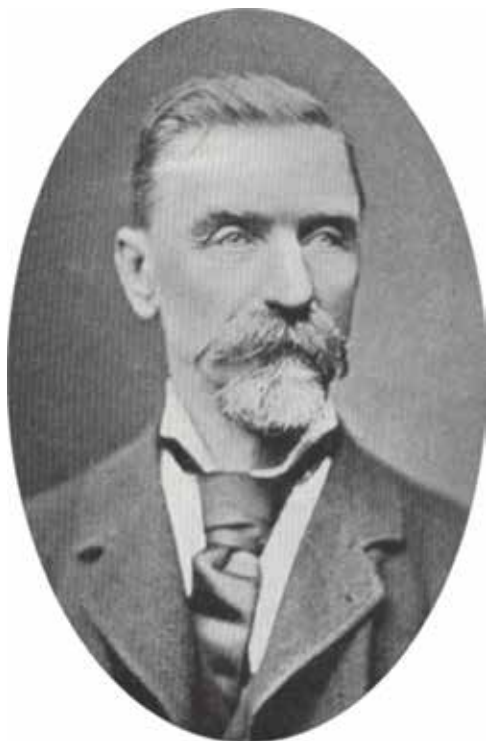
Ryc. 1. Portret Wiktora Ignacego Godlewskiego