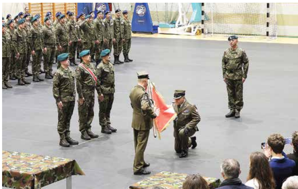
Ryc. 9. Uroczyste nadanie 22. Wojskowemu Ośrodkowi Kartograficznemu w Komorowie imienia ppłk. Mieczysława Szumańskiego ps. „Bury” – wręczenie Chorągwi Wojska Polskiego (15.11.23)