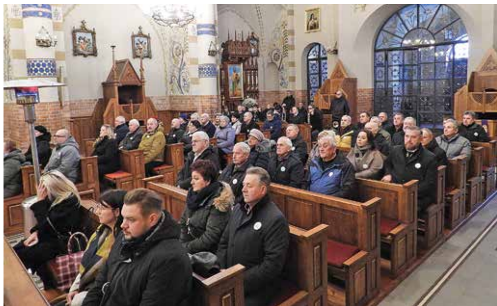
Ryc. 4. Uczestnicy mszy świętej.