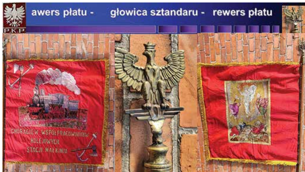
Ryc. 13. Rewers, awers i głowica historycznej chorągwi kolejarskiej.

W przeszłości kolejarska chorągiew (nazwa sztandar została wprowadzona dopiero na przełomie lat 20/30 XX wieku i dotyczyła początkowo tylko sztandarów wojskowych) uczestniczyła we wszystkich lokalnych wydarzeniach. Była ważnym symbolem dla społeczności kolejarzy i towarzyszyła przez lata jej członkom, także w ich ostatniej drodze.