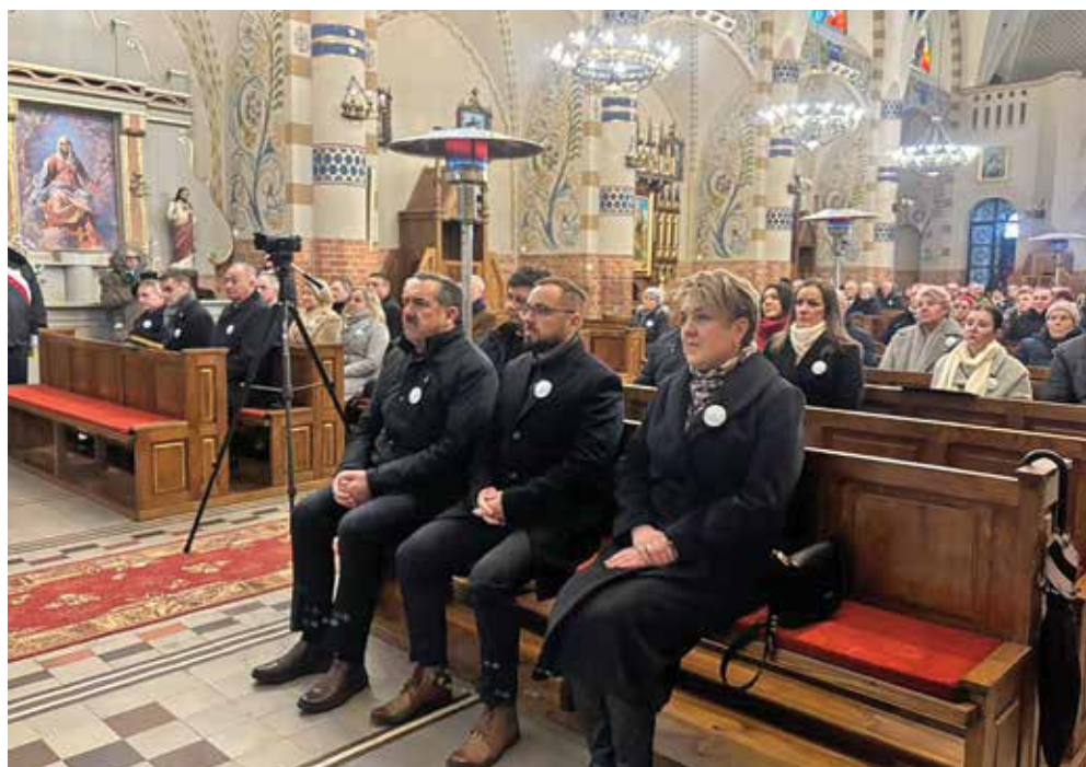
Ryc. 3. Uczestnicy mszy świętej.