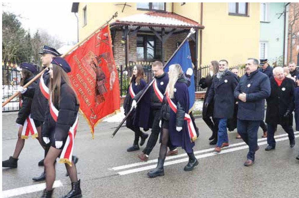
Ryc. 14. Przemarsz ulicami Małkini. Na pierwszym planie historyczna chorągiew kolejarska.