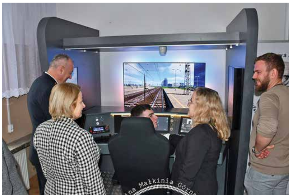
Ryc. 16-17. Technikum Kolejowe, otwarcie klasopracowni z nowym symulatorem.