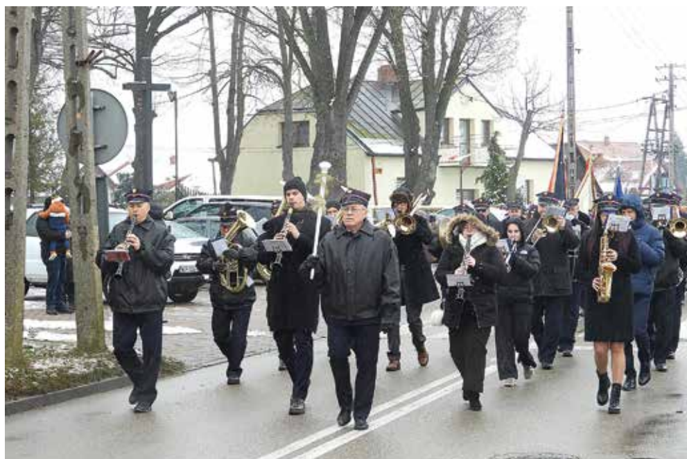
Ryc. 5. Kolejowa Orkiestra Dęta z Siedlec w czasie uroczystości.

Oprawę muzyczną uroczystości zapewniła Kolejowa Orkiestra Dęta z Siedlec, która po mszy świętej poprowadziła ulicami Małkini na teren stacji kolejowej pocztą sztandarowe i przybyłych gości.