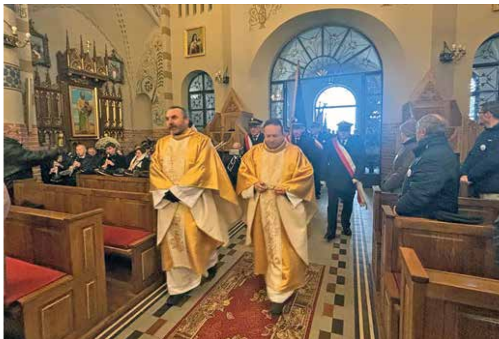
Ryc. 2. Wprowadzenie sztandarów i uczestników mszy św. do kościoła pw. Najświętszego Serca Jezusowego w Małkini.