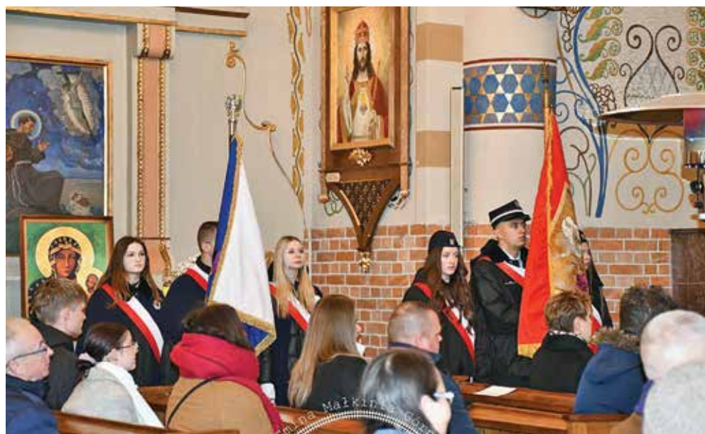
Ryc. 11-12. Sztandary w asyście pocztów sztandarowych podczas mszy św. Zdj. UG Małkinia Górna