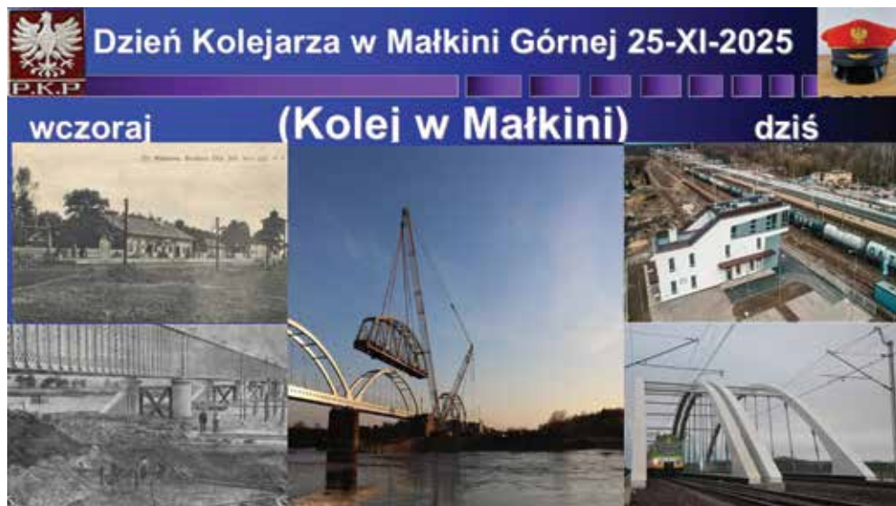
Ryc. 1. Przemiany na przestrzeni lat.