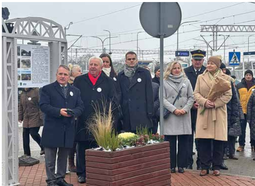
Ryc. 9. Mieszkańcy Małkini i zaproszeni goście w czasie uroczystości odsłonięcia pomnika.