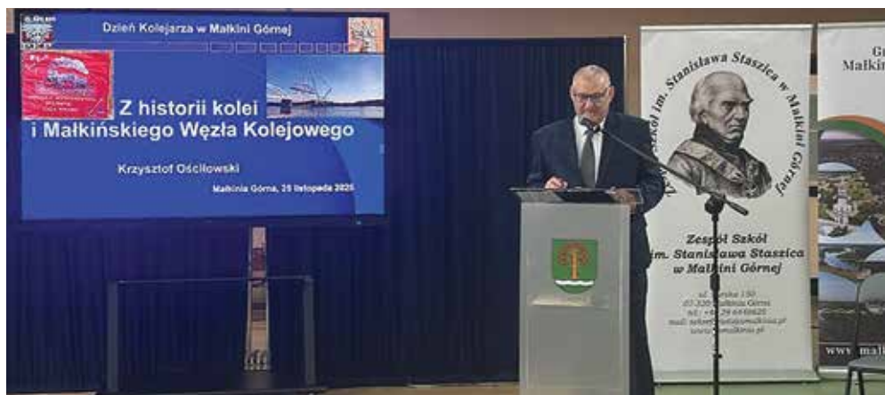
Ryc. 18-19. Wykład na temat historii kolei i węzła małkińskiego.