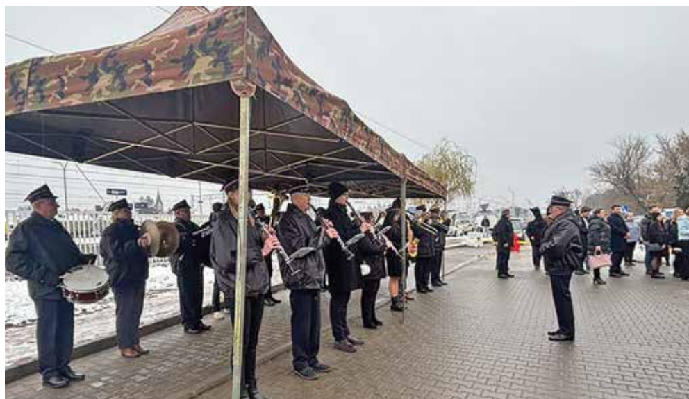
Ryc. 6. Kolejowa Orkiestra Dęta z Siedlec w czasie uroczystości.