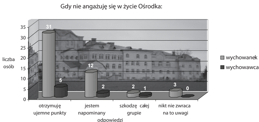
Wykres 3. Konsekwencje braku zaangażowania się w życie Ośrodka.