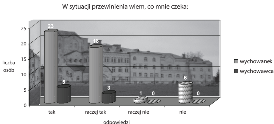
Wykres 1. Znajomość konsekwencji negatywnych zachowań.

Z przeprowadzonych w tej placówce badań wynika, że zdecydowana większość wychowanków wie, co mogą wywołać określone przewinienia (por. wykres 1). Wszyscy wychowawcy twierdzą, że wychowankowie są świadomi konsekwencji, jakie mogą ich spotkać. Jedynie siedmiu chłopców nie wie, co ich czeka w sytuacji przewinienia.