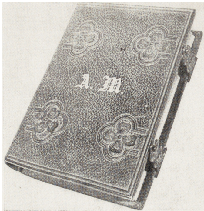
Album zdjęć rodzinnych należący dawniej do Adama Mickiewicza