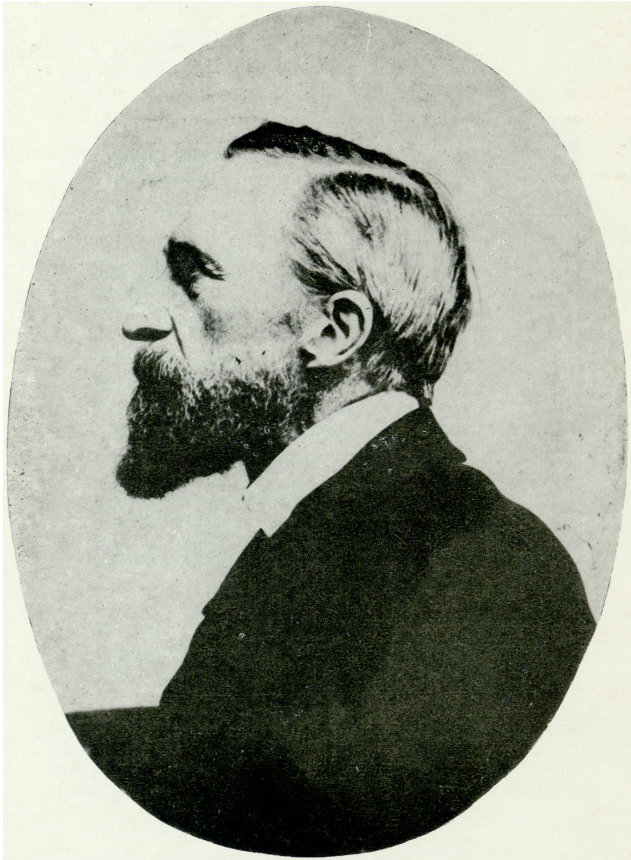
Józef Ignacy Kraszewski. Fot. około 1867 r.