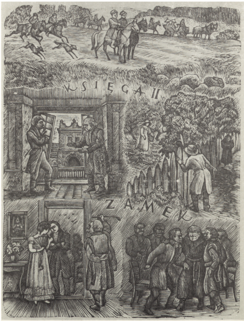
Pan Tadeusz. Ilustrował Wacław Radwan