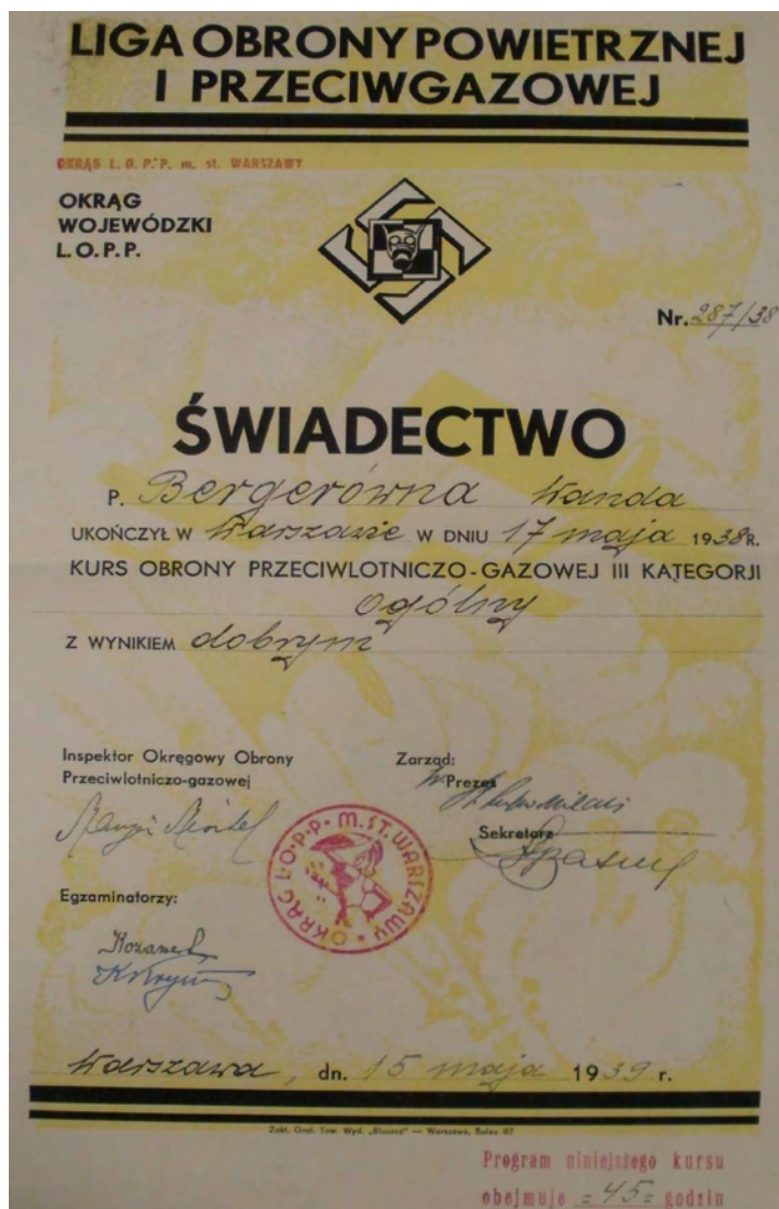
Świadectwo kursu obrony przeciwlotniczo-gazowej.

się. W szerszym zakresie, również w oparciu o ćwiczenia praktyczne, problematyka ta pojawiała się na obozach instruktorskich 51 .