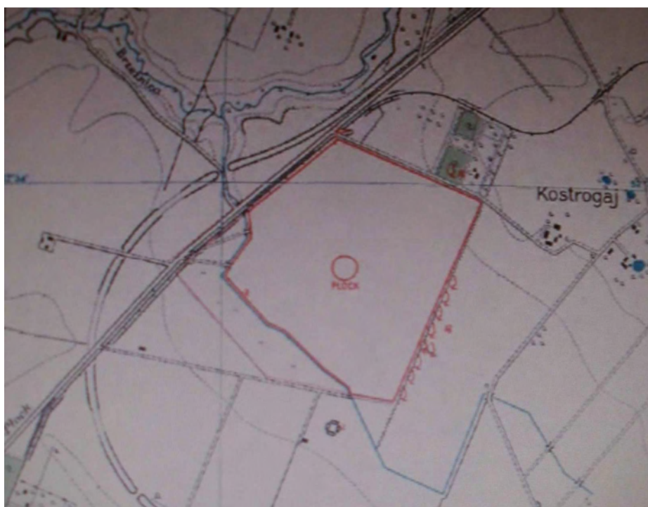
Plan lotniska płockiego.