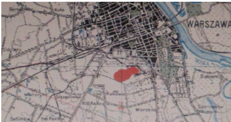
Położenie lotniska warszawskiego na Mokotowie.

Jednym ze statutowych celów LOPP była budowa lotnisk i urządzeń lotniskowych. Zwykle lotniska posiadały przeznaczenie sportowe, ale w przyszłości mogły służyć lotnictwu wojskowemu. 8 maja 1928 r. szef Sztabu Głównego gen. dyw. Tadeusz Piskor zatwierdził plan rozbudowy lotnisk na terenie Rzeczypospolitej, który zakładał harmonogram tych prac do 1935 r. 42