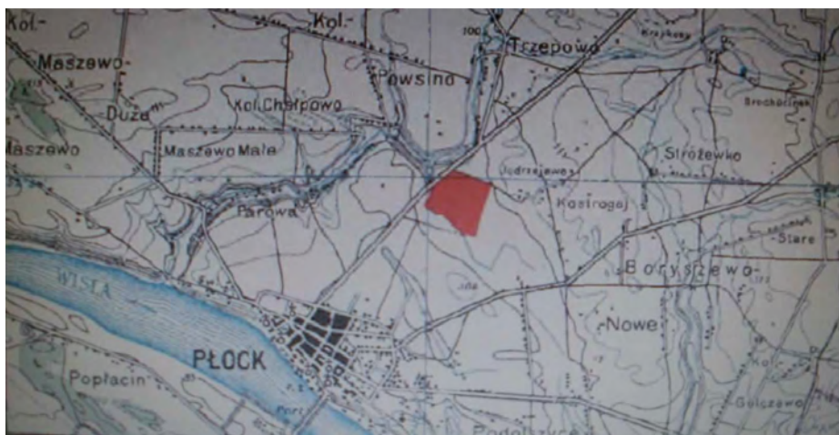
Położenie lotniska płockiego na Kostrogaju.