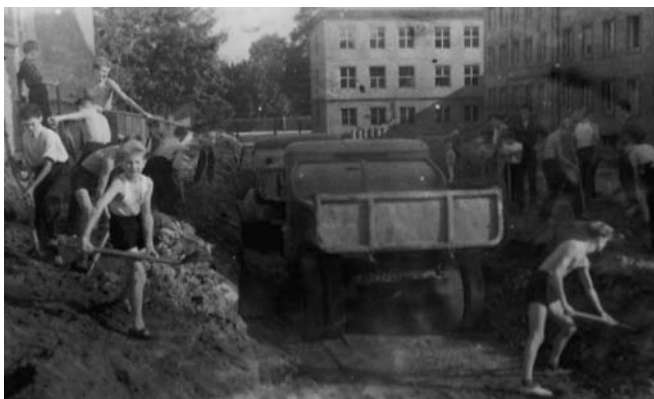
Budowa chodników i wjazdu do szkoły – 1957 r.