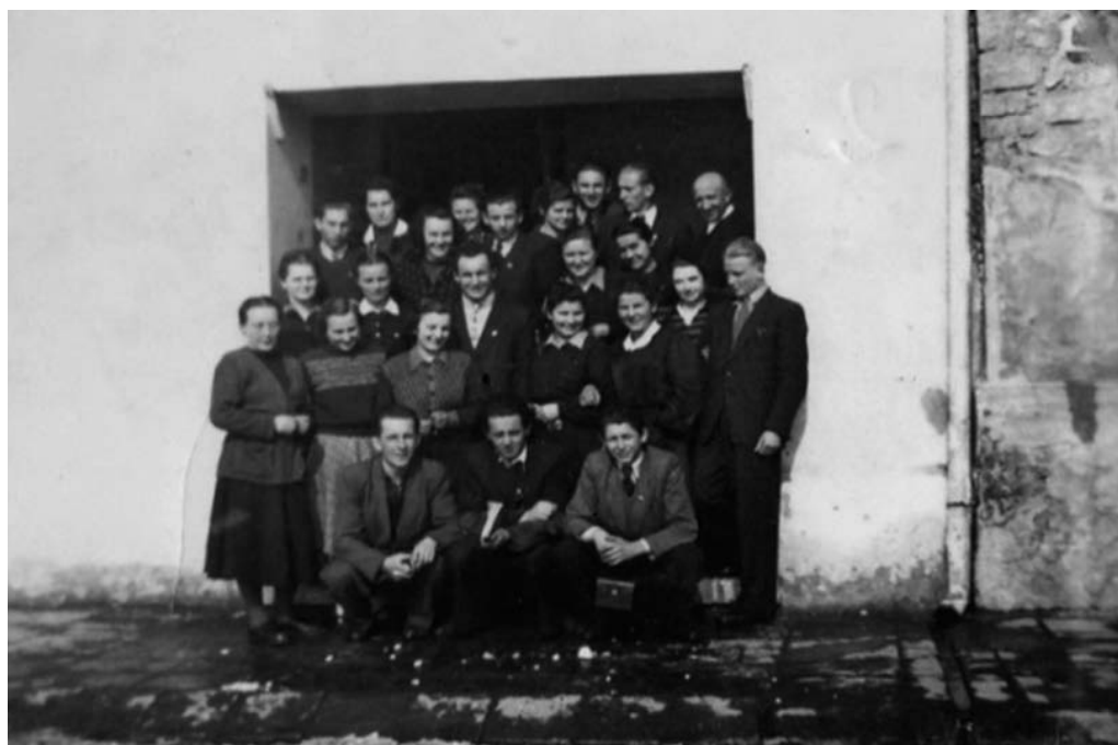
Klasa IIa LP przed budynkiem na ul. Reformackiej 4, gdzie mieściła się pracownia fizyczno-chemiczna – 1949 r.