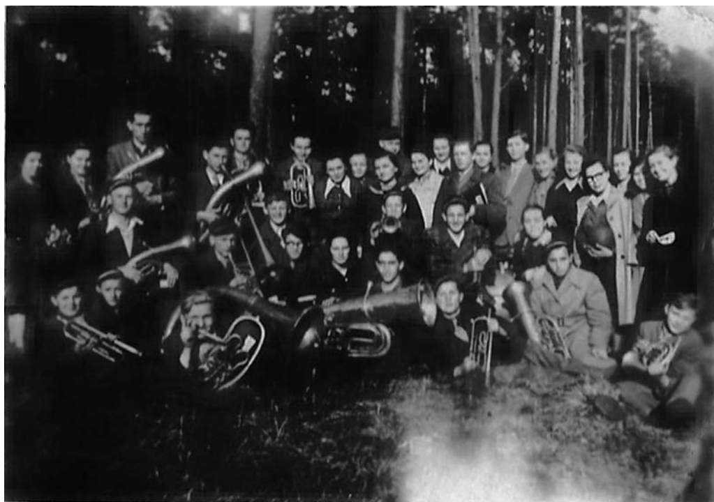
Orkiestra Liceum Pedagogicznego – 1953 r.