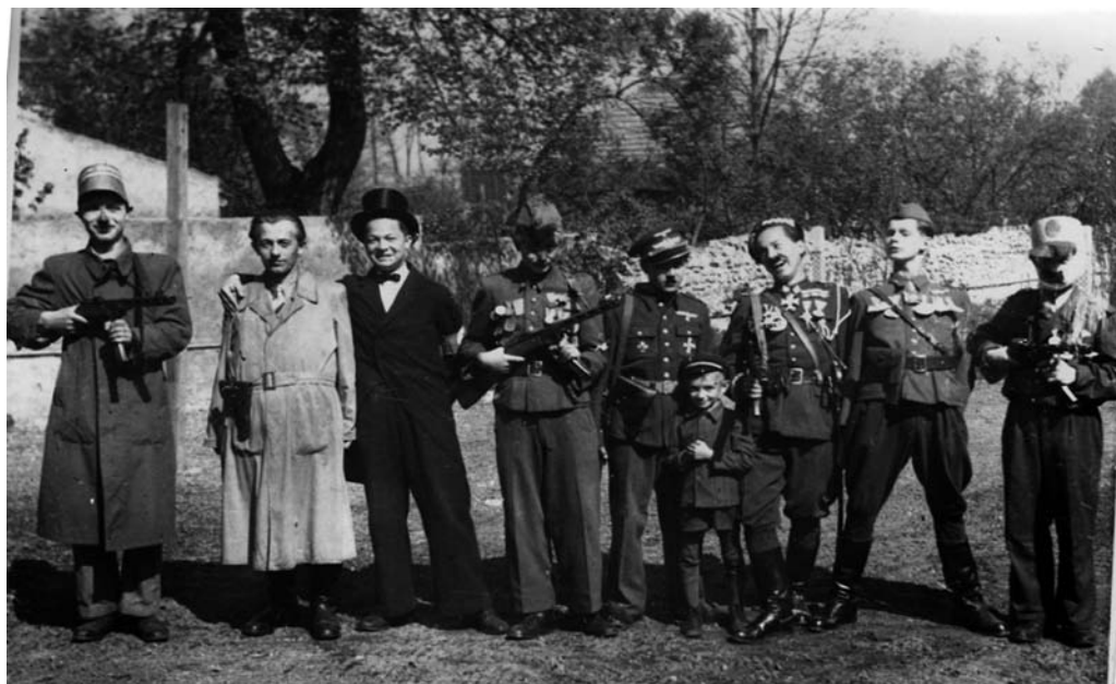
Uczniowie LP (zespół teatralny) parodiujący przywódców państw antykomunistycznych – obchody święta 1 maja 1953 r.