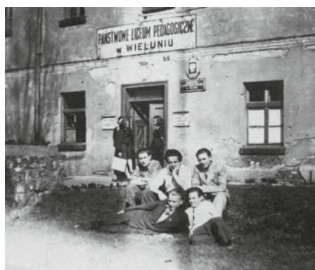
Uczniowie przed wejściem do budynku szkoły przy ul. Wodnej, 1948 r.