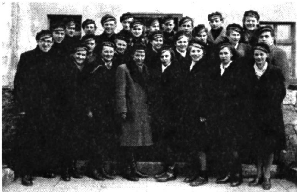
Pierwsi maturzyści rocznik 1948