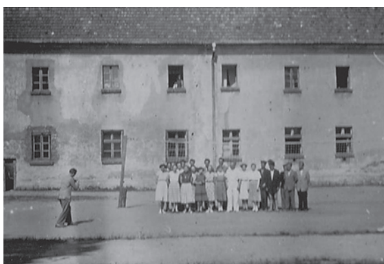
Uczniowie na urządzonym przez siebie boisku do siatkówki, wiosna 1947 r.