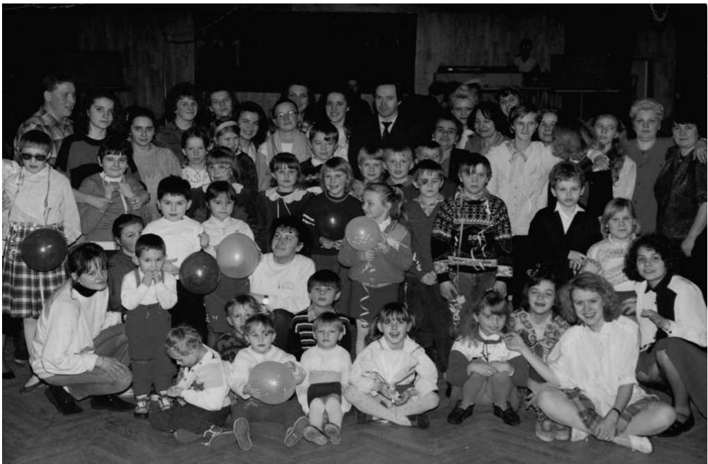
„Choinka” zorganizowana przez słuchaczy SN dla dzieci w TPD, 1993 r.