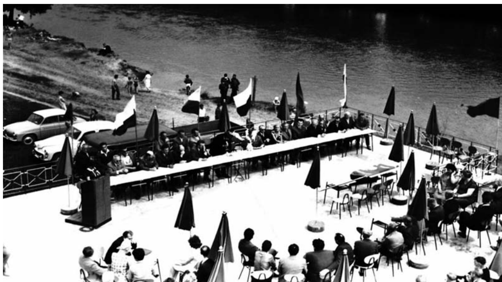
Otwarcie Ośrodka Sportów Wodnych w Krzczewie