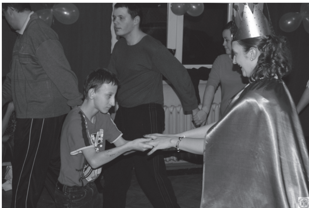
Bal karnawałowy dla dzieci z Ośrodka Szkolno-Wychowawczego w Gromadzicach, słuchacze KN i wychowankowie ośrodka, (fot. ze zbiorów autorki)