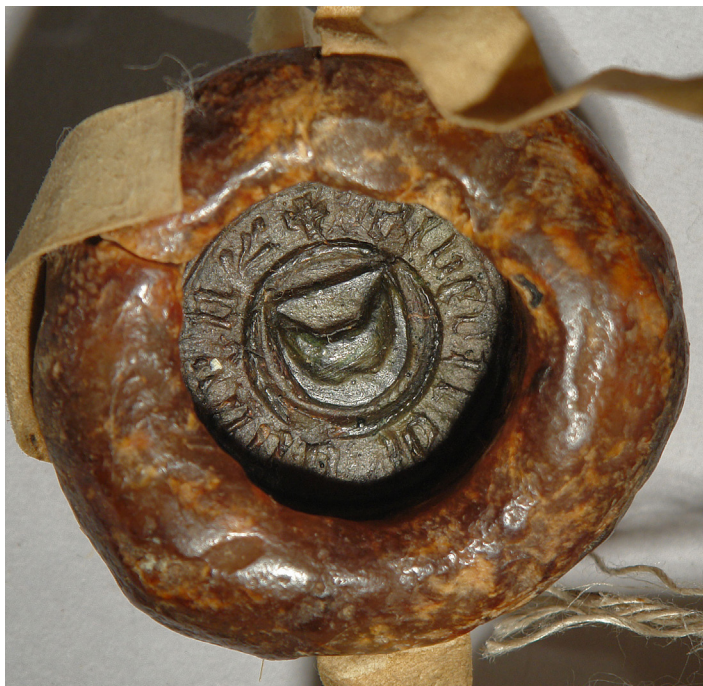
Fot. 6. Pieczęć przywieszona przez kasztelana gnieźnieńskiego Piotra z Bnina