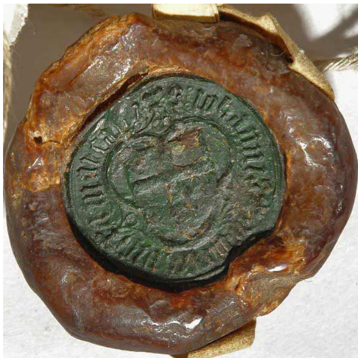
Fot. 4. Pieczęć marszałka Królestwa Polskiego Jana Głowacza z Oleśnicy