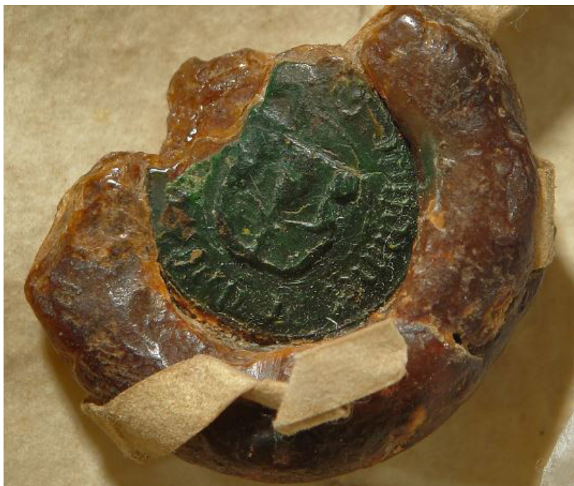
Fot. 2. Pieczęć wojewody brzeskiego Jana z Lichenia