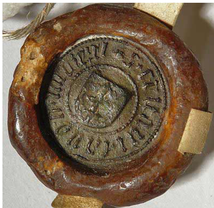
Fot. 5. Pieczęć kasztelana sądeckiego Krystyna z Koziegłów