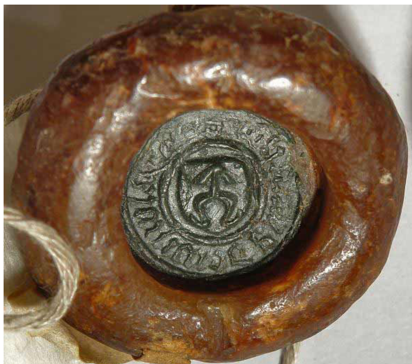
Fot. 3. Pieczęć niezidentyfikowanego dysponenta herbu Odrowąż