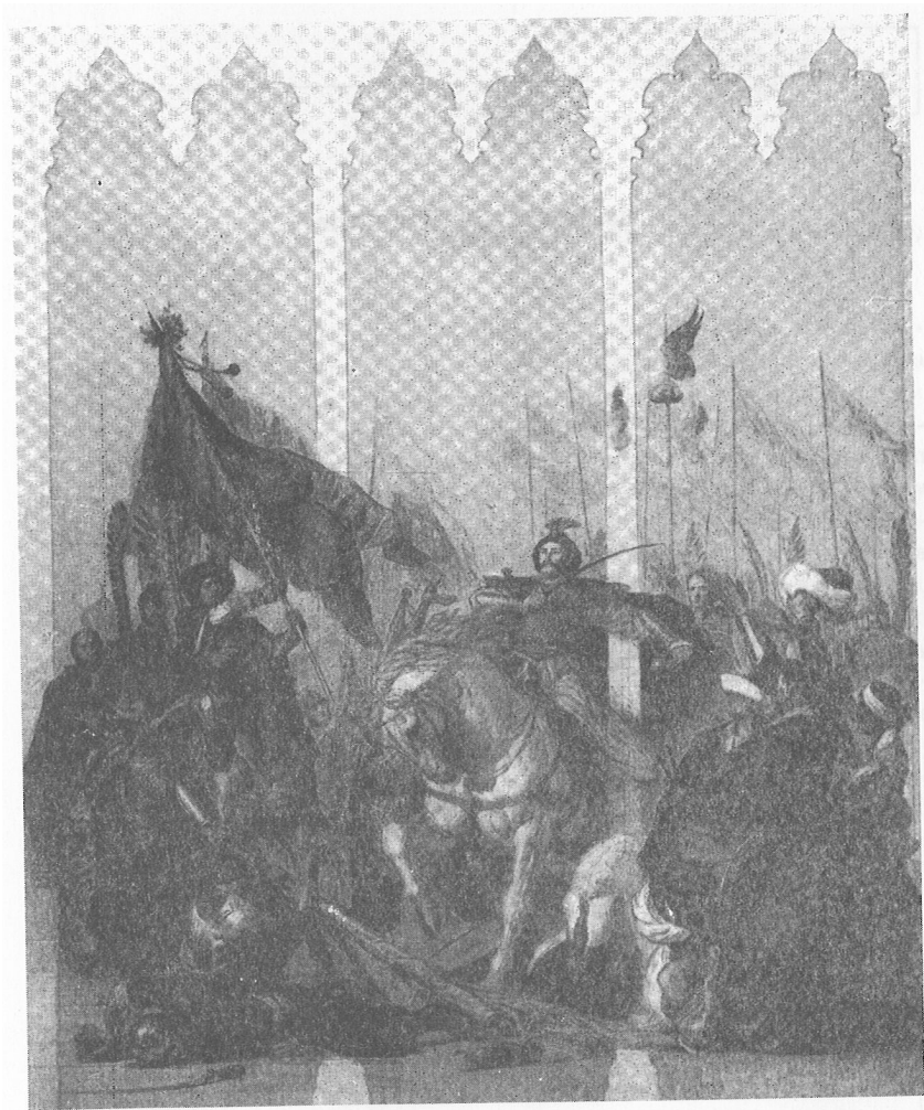
6. Arturo Gatti, Cud Matki Boskiej Loretańskiej podczas bitwy wiedeńskiej , 1929, karton polichromii kaplicy polskiej w sanktuarium w Loreto.