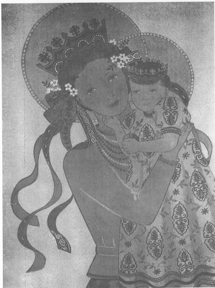
4. Maria Hablińska-Mglejowa, Matka Boska Krakowska , 1949; linoryt kolorowy.