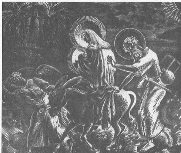
2. Edmund Ludwik Bartłomiejczyk, Ucieczka z Betlejem , 1937, drzeworyt.