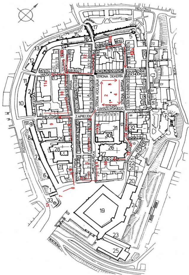
Rys. 1 – Plan Starej Warszawy z zaznaczeniem kamienic i kierunku zbierania kontrybucji w 1704 r.