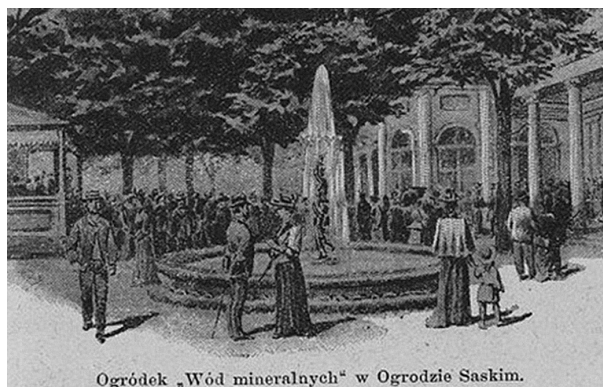
Ogródek „Wód mineralnych” w Ogrodzie Saskim.