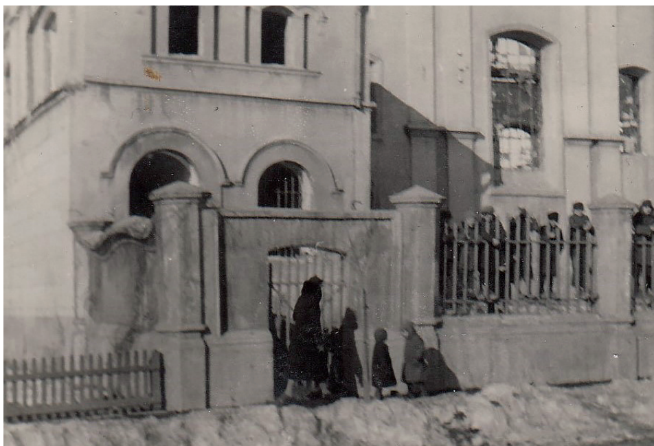
Fot. 10. Nierdzebrannte Synagoge in Łęczyca