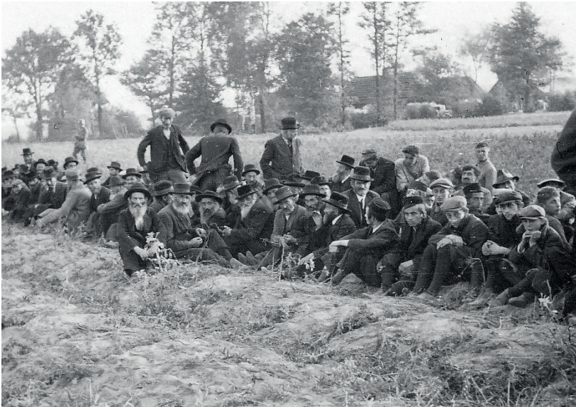
Fot. 18. Kolbuszowa, vor der Hinrichtung