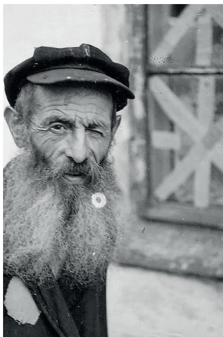
Fot. 4. Łowicz, „Ostjude“