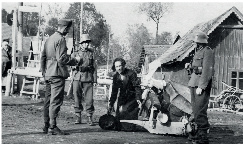
Fot. 1. Krosno, „Ostjude“

So sind in der Ikonographie von Nummer 1 bis Nummer 4 Szenen zu sehen, in denen die Deutschen den Juden, auf den sie treffen, demütigen. Dann wählen sie in ihren fotografischen Kompositionen solche Szenen mit dem Juden aus, die zu ihrem ideologischen Bild von „Ostjuden“ passen.