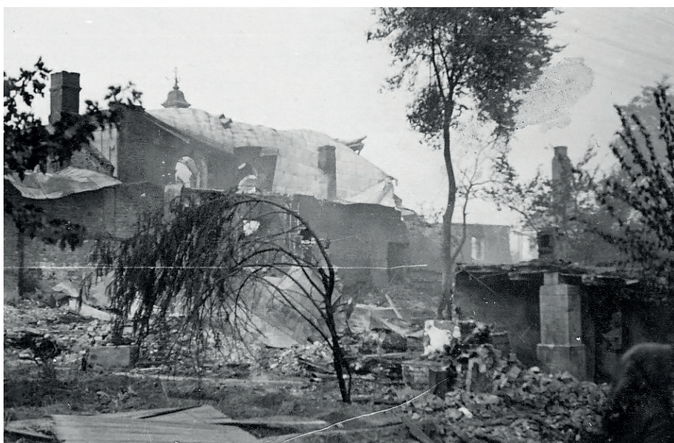
Fot. 13. Niedergebrannte Synagoge in Przeworsk