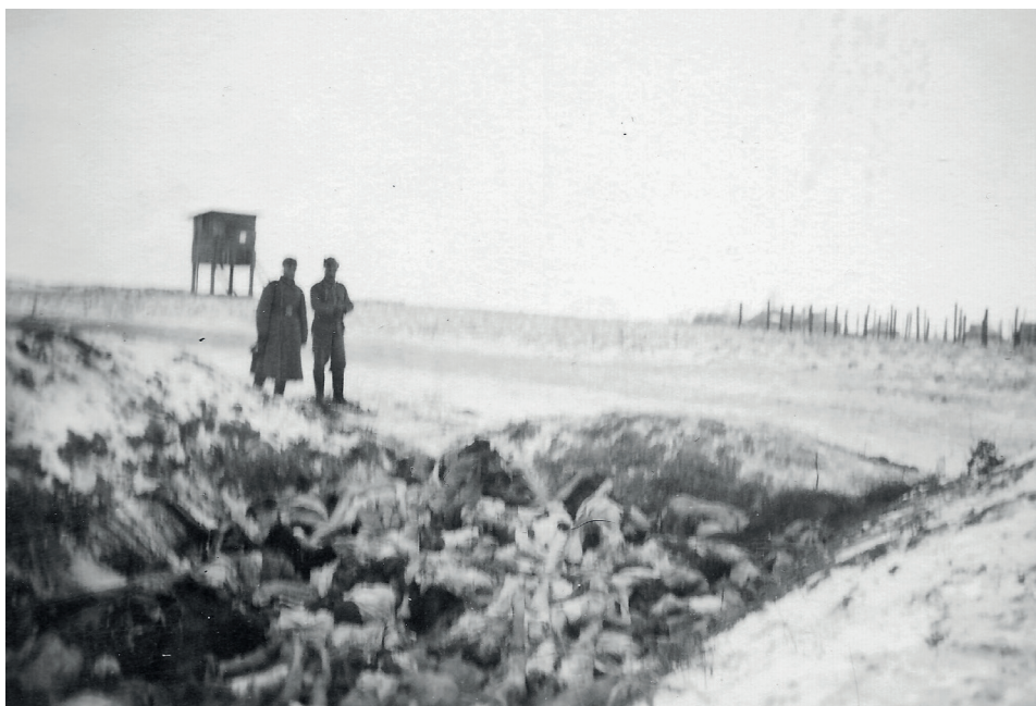
Fot. 21. Sobibór