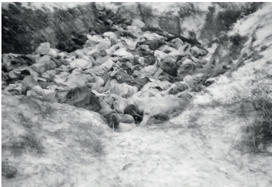
Fot. 22. Sobibór