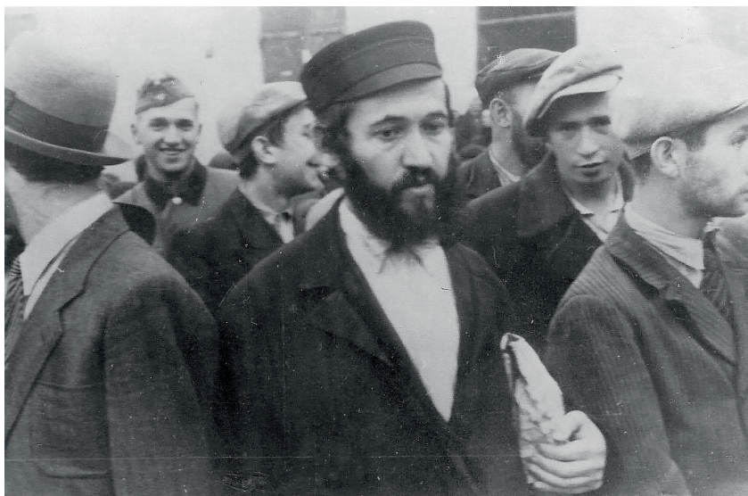
Fot. 6. Białystok, „Ostjude“