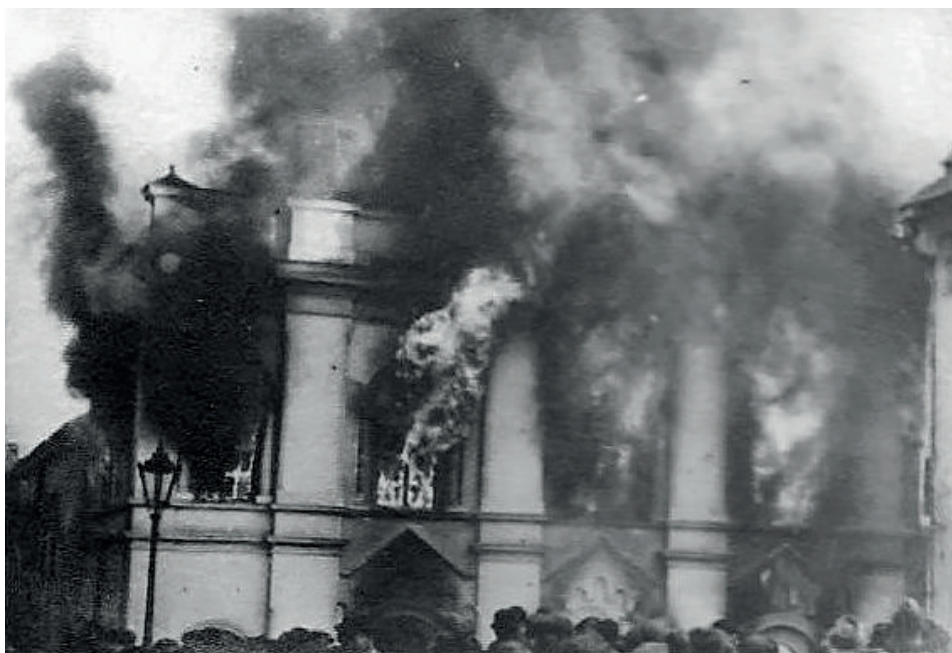
Fot. 14. Brennende Synagoge in Tarnów