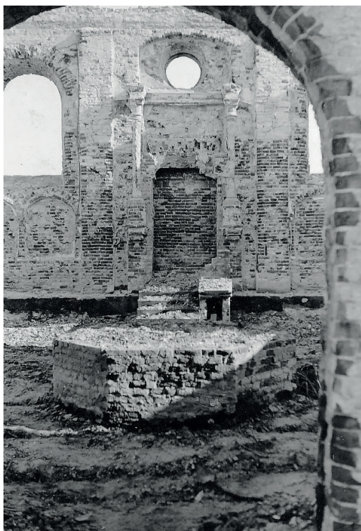
Fot. 16. Niedergebrannte Synagoge in Tyszwce

Die folgenden Jahre der Besetzung brachten einige der schrecklichsten Momente in der Geschichte der Menschheit. Exekutionen und Todestransporte in die Vernichtungslager waren an der Tagesordnung. Ikonografische Zeugnisse belegen bis heute die an den polnischen Juden begangenen Verbrechen. Zentralisiert, isoliert, warteten sie auf den Tod 38 . Systematische Transporte zu den Orten des Martyriums und der Vernichtung verließen die Städte und Ortschaften planmäßig bis in die letzten Stunden der Vernichtung. Viehwaggons, damals unmenschlich voll mit den letzten noch lebenden Juden, machten sich regelmäßig auf den letzten Weg in die Vernichtungslager. So ging die Welt unwiederbringlich verloren, ein Teil der Kultur und der Identität der Heimat, der gemeinsamen Heimat, der Heimat, die Polen war, wurde für immer ausgeradiert.