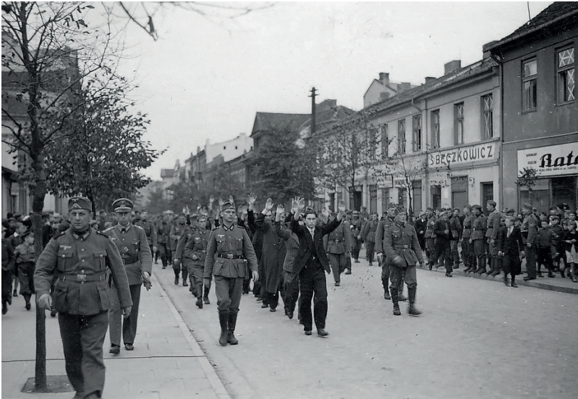
Fot. 17. O.u., vor der Hinrichtung

Auch hier sehen wir die letzten Momente im Leben der Juden, die zur Erschießung transportiert, in die Todesgruben geführt und in den Gaskammern der Konzentrationslager getötet wurden. Auch hier zeigt der Autor des Artikels Fotos unter den Nummern 17 bis 22, auf denen die deutschen Henker den Moment des Grauens, des Schreckens und des bevorstehenden Todes in Kameras festhielten.