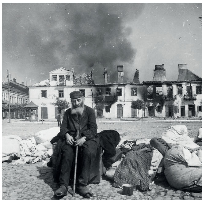
Fot. 8. Zwoleń, „Ostjude“