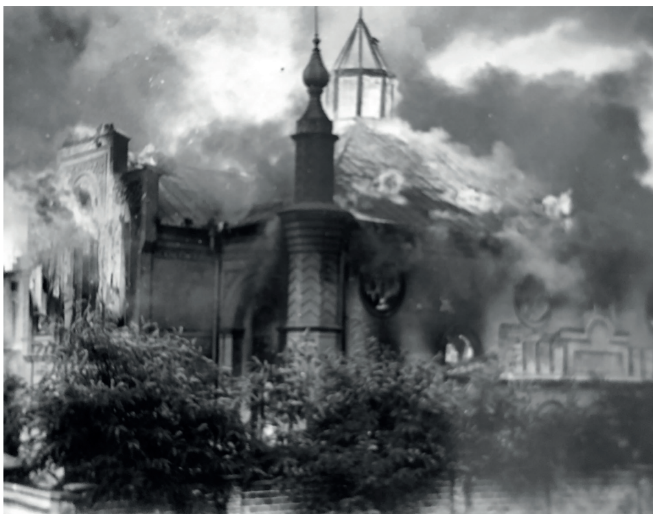
Fot. 9. Brennende Synagoge in Włocławek

Auch bei der Zerstörung der Synagogenarchitektur in Polen – der Autor zeigt hier die Fotos 9 bis 16 – mangelte es den Deutschen nicht an Phantasie. Mit ihren Kameras dokumentierten sie die letzten Momente der Synagogen, die jahrhundertlang Teil der polnischen Landschaft und der polnischen Identität gewesen waren.