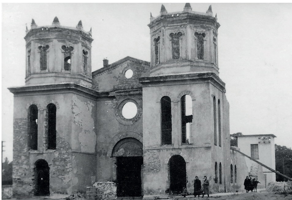
Fot. 15. Niedergebrannte Synagoge in Mielec