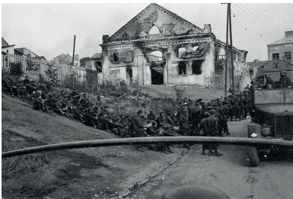
Fot. 12. Niedergebrannte Synagoge in Łowicz