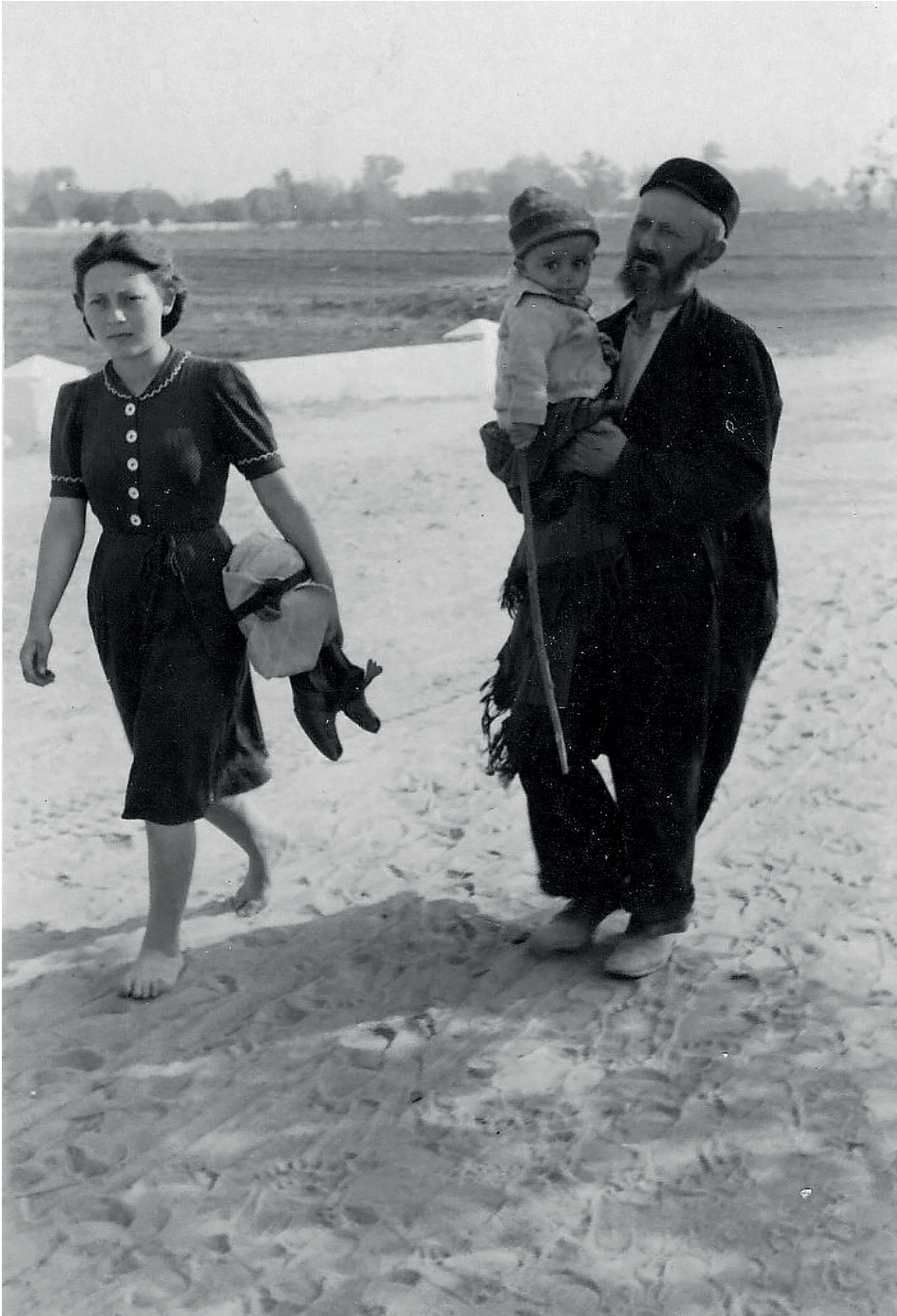
Fot. 2. Białystok, „Ostjuden“