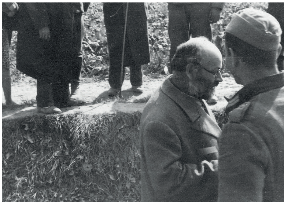
Fot. 19. O.u., vor der Hinrichtung