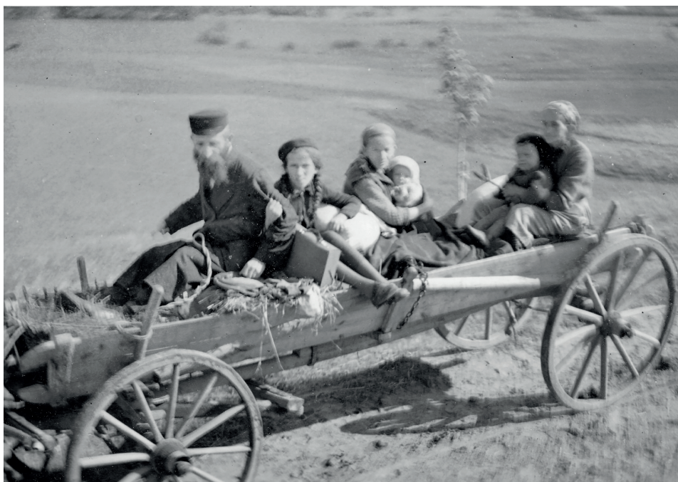
Fot. 3. „Ostjüdische“ Familie