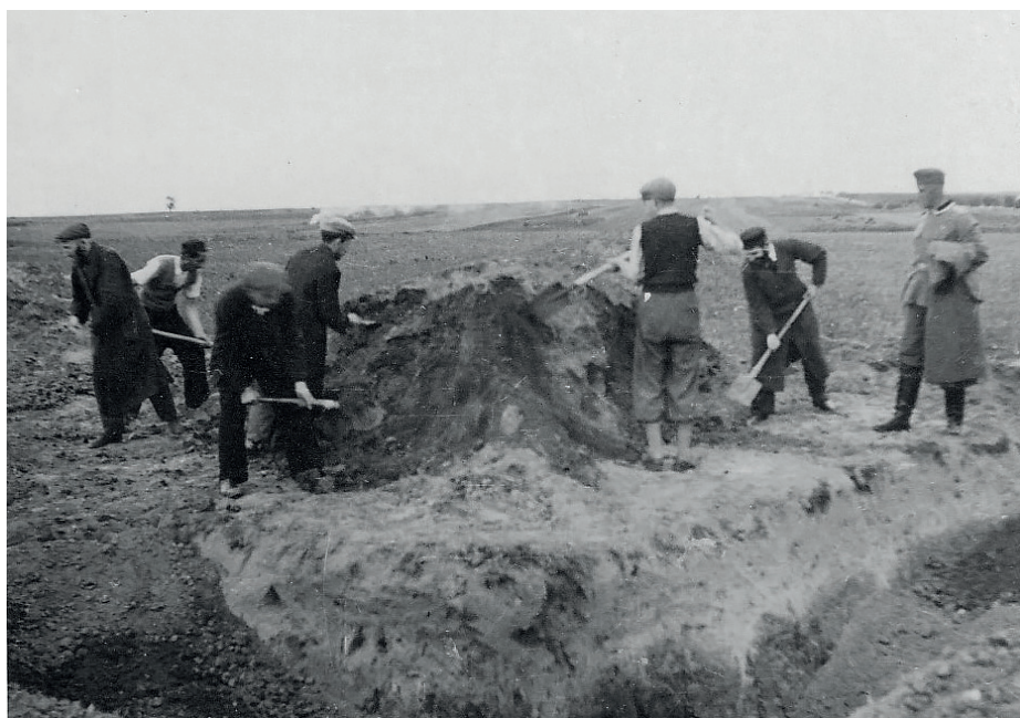
Fot. 20. O.u., vor der Hinrichtung