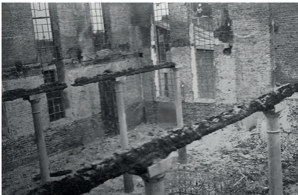
Fot. 11. Nierdzebrannte Synagoge in Aleksandrów Łódzki