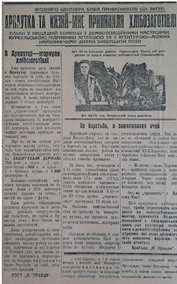
Фот. 3. Стаття в газеті «Наддніпряньська правда» за лютий 1932 р. про незадовільний хід хлібозаготівлі

До обшуків залучали мешканців міста. Газети розповідали про куркулів, що обжираються хлібом, крадуть колгоспне майно, не дають хліба місту 28 . З робітників формували загони, що проводили обшуки. Траплялось, що такий загін, прибувши в напівмертве село, відмовлявся забирати продукти. Також обмежувались розмовами з селянами, що скаржились на голод і пусті комори. Але голодним