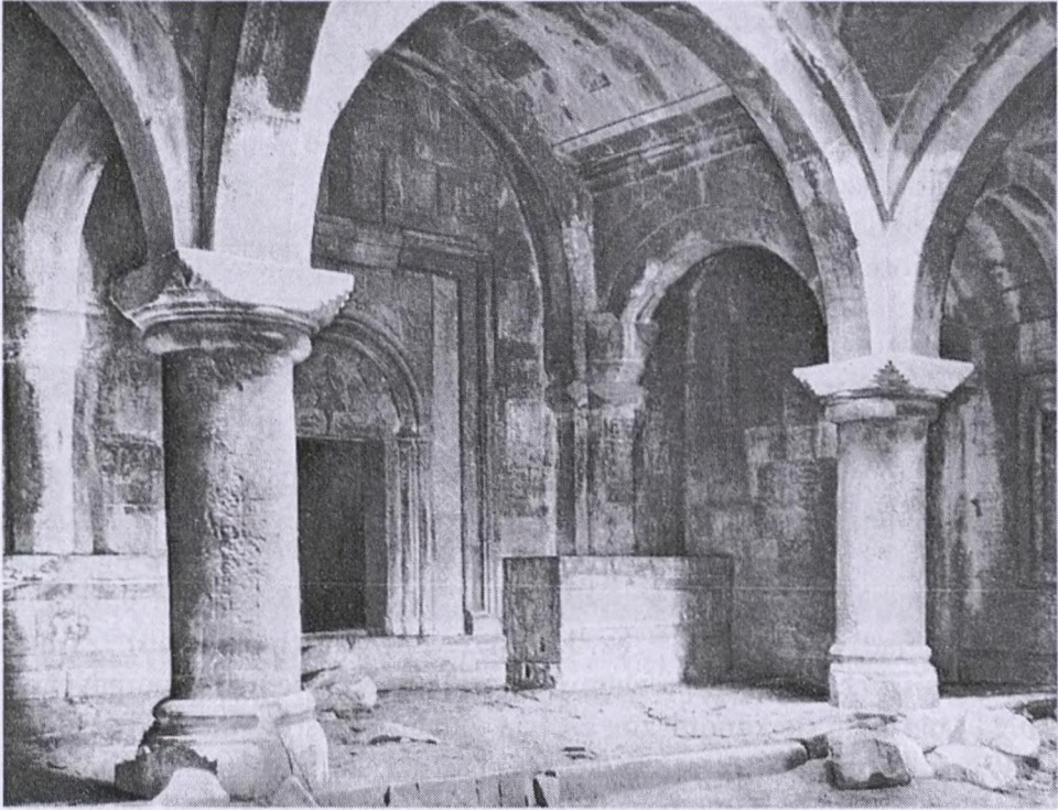
2. Klasztor Khoranašat, Žamatun (1251), wewnątrz (O. X. Халпахчян, Архитектурные ансамбли Армении 8 в. д.н.э. – 19 в. н.э. Architectural ensembles of Armenia 8 c. B.C. – 19 c. A.D. , Москва 1980, s. 429)

znajduje wystarczającego potwierdzenia. Przed połową VII w. chrzest mógł być udzielany przez zanurzenie, co sugeruje pojedynczy przykład basenu w Zvartnoc. Już wówczas wykształcił się jednak zwyczaj – praktykowany w stuleciach następnych – udzielania sakramentu dzieciom. Służyły do tego chrzcielnice umieszczane wewnątrz kościołów, we wschodniej części północnej ściany bocznej.