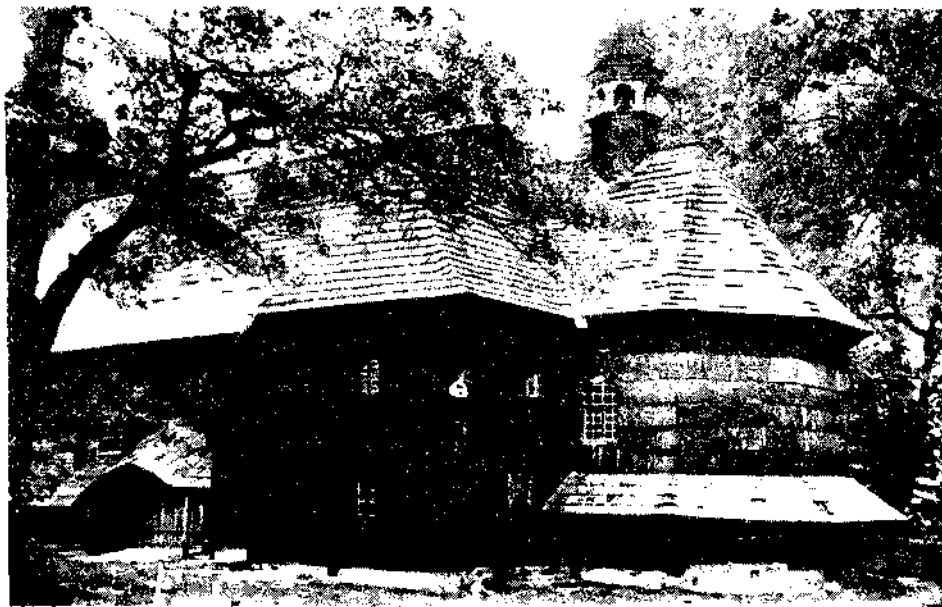
Widok od południowego wschodu na prezbiterium, zakrytą z chórem kolatorskim, schody chórowe oraz wejście od południa.