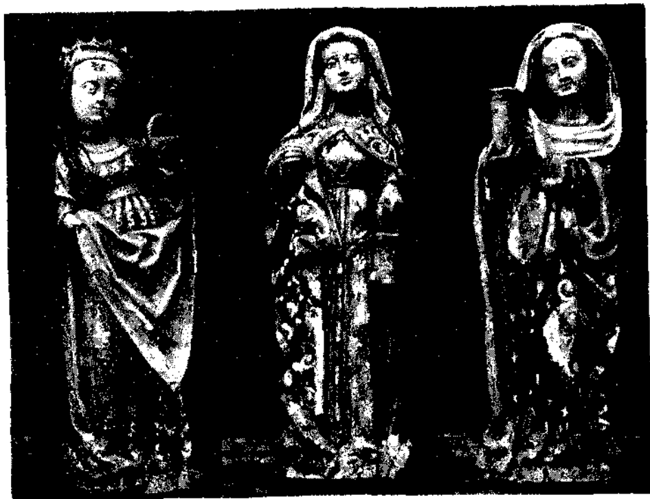
Zabytkowe figury św. św. Elżbiety, Doroty (?) i Magdaleny.