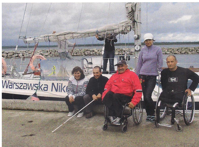
Fot. 4. Niepełnosprawna część załogi jachtu Warszawa Nike

Organizatorem dwóch dwutygodniowych rejsów na jachcie Warszawa Nike dla osób niepełnosprawnych w 2011 r. był Klub Sportowy Niepełnosprawnych Start z Warszawy. W wyprawach tych wzięło udział 5 osób niepełnosprawnych – głównie z dysfunkcją ruchu lub słuchu – i 5 osób pełnosprawnych. W pierwszym etapie rejsu załogi odwiedziły porty Bornholmu, Christianso i Kalskrone. Rejs zakończył się we Władysławowie, skąd rozpoczął się następny etap wyprawy – do Marienhaminy, Sztokholmu i Ventspils. Ogółem w trakcie rejsów przepłynięto łącznie ponad 1200 Mm i odwiedzone 10 portów położonych na terytorium 5 państw 10 .