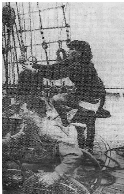
Fot. 1. Rejs osób niepełnosprawnych z dysfunkcją narządów ruchu na żaglowcu General Zaruski 1989 r.

Końcowe lata 80. XX w. w żeglarstwie polskim charakteryzowały się wzrostem zainteresowania żeglarstwem klubowym. W tym okresie powstało szereg organizacji i stowarzyszeń zajmujących się promocją żeglarstwa dla osób niepełnosprawnych i nieprzystosowanych społecznych. Celem ich była aktywizacja osób niepełnosprawnych do uprawiania tej dyscypliny.