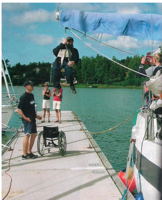
Fot. 3. Wykorzystanie bomu do transportu osób niepełnosprawnych na pokład

Ogólnopolska Rada Studentów Niepełnosprawnych przy Radzie Naczelnej ZSP w Warszawie zorganizowała w 1989 r. dla osób niepełnosprawnych wyprawę. W rejsie uczestniczyło 12 Holendrów i 23 polskich żeglarzy; w liczbie 35 uczestników jedna trzecia stanowili żeglarze na wózkach inwalidzkich 8 .