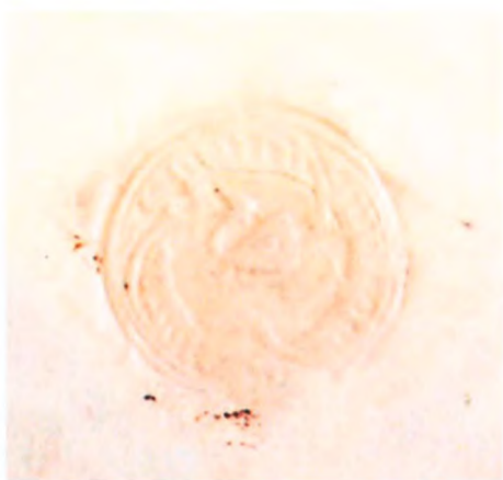
Fot. 5. Pieczęć Żmigrodu – XV w.