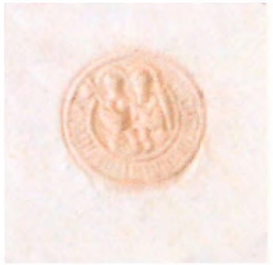
Fot. 1. Pieczęć Biecza – przełom XV XVI w.