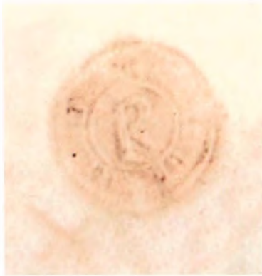
Fot. 2. Pieczęć Grybowa – XV w.